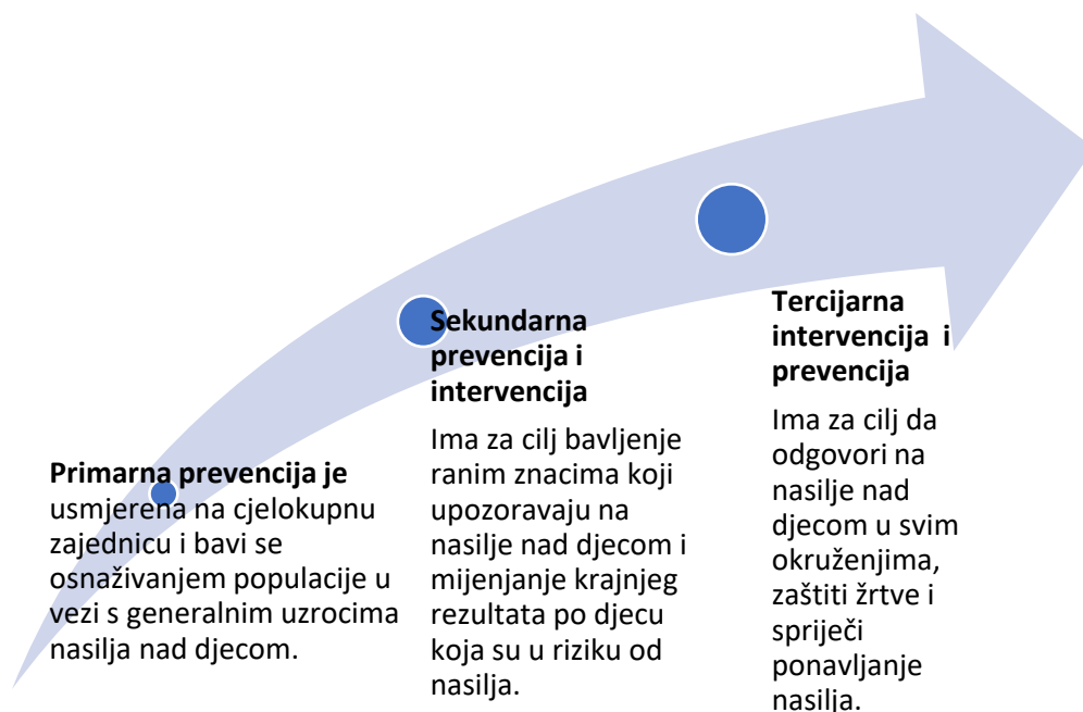
Slika 1: Tri nivoa prevencije i intervencije uključena u Strategiju

Strategija se zasniva na pristupu zasnovanom na ljudskim pravima i nastoji da svoju svrhu ostvari kroz tri nivoa prevencije i intervencije, kao što je prikazano na slici: