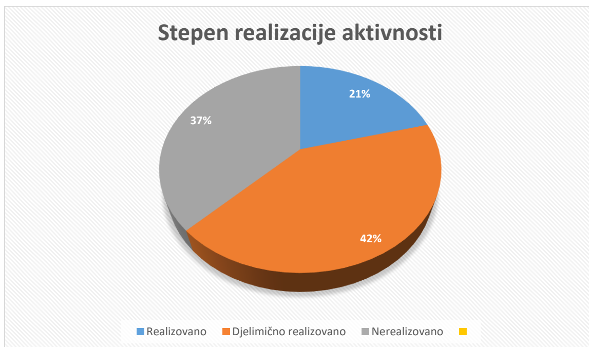
Grafikon 1.1 – Procentualni prikaz stepena realizacije planiranih aktivnosti

Od ukupno 187 planiranih aktivnosti, realizovano je 39 aktivnosti, djelimično realizovano 78 aktivnost, a nije realizovana 70 aktivnost.