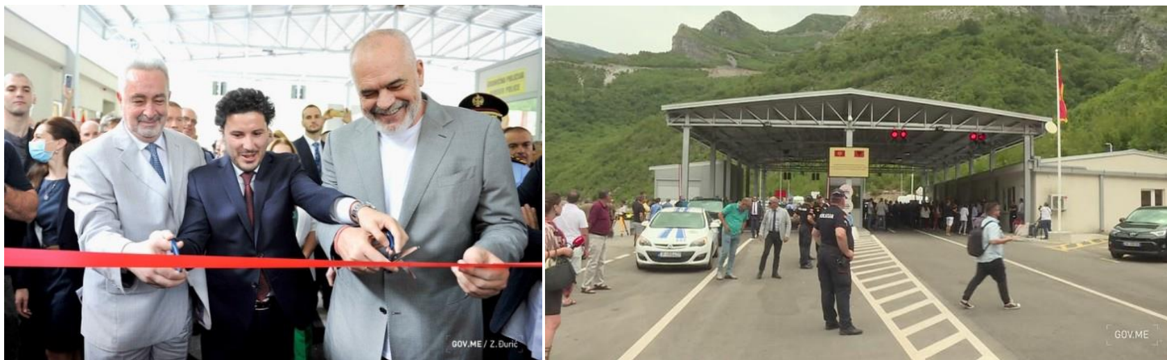
Zajednički granični prelaz Zatrijebačka Cijevna- Grabon, na teritoriji Crne Gore, otvoren je 03. avgusta 2021.godine