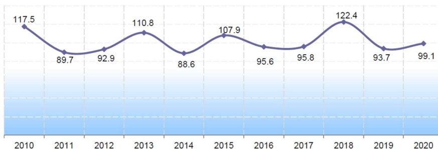
Grafik 1. Godišnji indeksi industrijske proizvodnje, 2010-2020

Kretanja u industrijskoj proizvodnji analizirana kroz indekse u sektorima B, C i D pokazuju da je obim industrijske proizvodnje u proteklih 10 godina održavan na približno istom novou uz izvjesne fluktuacije. Najveći rast godišnjeg indeksa industrijske proizvodnje je zabilježen 2018. godine (122,4), a najveći pad u 2014. (88,6) (Grafik 1). Kretanja godišnjih indeksa industrijske proizvodnje u periodu 2018-2020. pokazuju da je opadajući trend iz 2019 smanjen u 2020. što ukazuje na otpornost industrije na krizne situacije (poput pandemije Covid-19) koje primarno pogađaju sektor usluga.