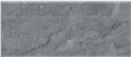
Alternativa 1: rješenje