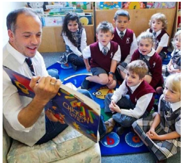
Fotografije: žene kao automehaničarka, muškarac kao vaspitač u vrtiću