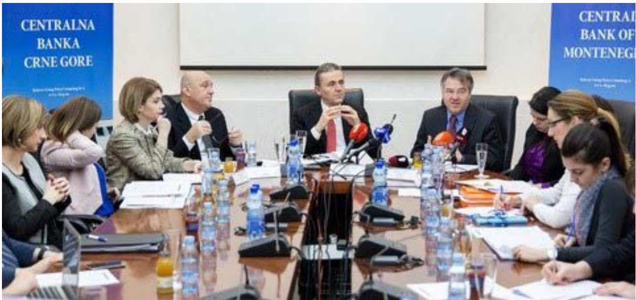
Fotografija: Ko predsjedava, upravlja i govori a ko radi i sluša?