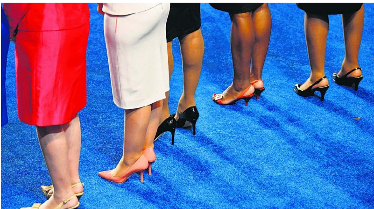
Fotografija: Žene koje donose odluke? (Noge pet članica američkog Kongresa)

Uvjerite se da odjeća i izgled muškaraca i žena odgovaraju kontekstu. Na primjer, nemojte koristiti fotografije reklamnih modela u bilo kojoj profesionalnoj objavi, a posebno ako se tekst odnosi na radno mjesto, poljoprivredna tržišta itd. Ne koristite fotografije i druge materijale koji namjerno ističu aspekte ili karakteristike ženskog tijela npr. u kojima su istaknute noge, grudi žena, dekoltei, botoksirane ili napućene usne, celulit, bore, zavodljive poze ili uska pripijena garderoba. Ne koristite ni komentare ispod fotografija kao što su šale, jezik ili aluzije koje degradiraju žene, uvredljive su ili svode žene na seksualne i objekte ekstremnih stereotipa. Ovo uključuje i zabranu eksplicitnih termina i fraza kojih ima beskrajno mnogo kao što su npr. "riba", "mačka", "kučka", "luče", "ona je jedino za kuhinju i krevet"... Zapamtite da nema rodno neutralnih alternativa ovakvom načinu ponižavanja i degradacije žena.