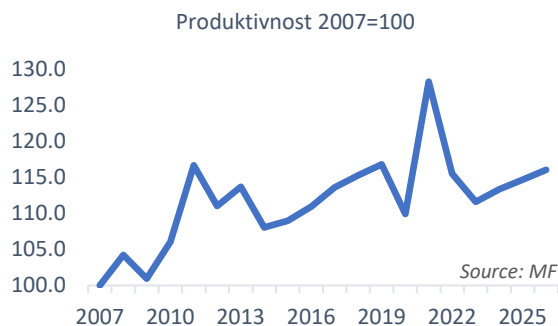
Slika: Produktivnost, 2007-2025

Procijenjena produktivnost rada je u periodu 2008-2023. godine porasla za približno 1%, pri čemu je zabilježila značajan pad u posljednje dvije godine, usljed velikog povećanja zaposlenosti. Raste brže od stope ekonomske aktivnosti i novogenerisanog BDP-a, zbog ograničenja i strukturnih izazova na domaćem tržištu rada. 14