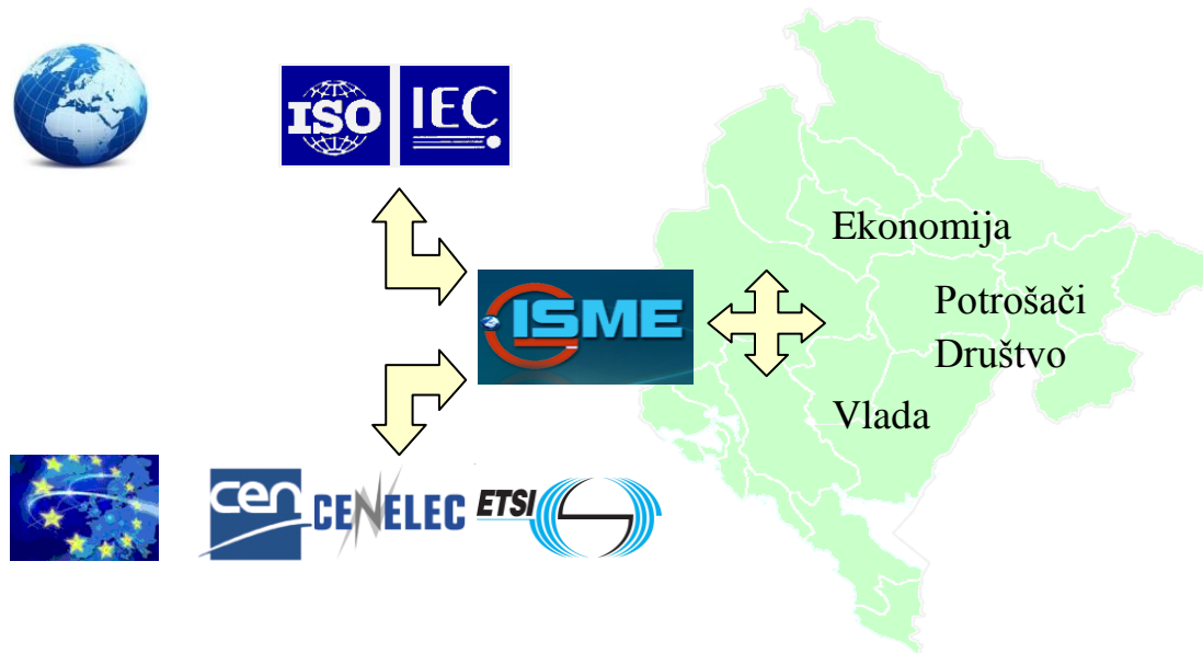
Slika 1: Sistem standardizacije u Crnoj Gori – mreža koja je povezana sa ostalim mrežama

oblasti standardizacije, Institut uspostavlja, održava i razvija sistem standardizacije u Crnoj Gori poštujući zahtjeve i preporuke međunarodnih i evropskih organizacija za standardizaciju. Ovaj umrežen sistem standardizacije predstavljen je na slici 1.