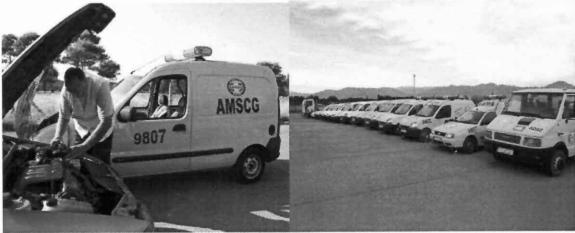
Prilog 1. Jedan dio vozila SPI za prevoz vozila kao i dio patrolnih vozila

Iako AMSCG pokriva cjelokupnu teritoriju Crne Gore u poslovima SPI, takodje će biti nastavljeno sa širenjem mreže SPI baza, te sezonsko instaliranja baza u sredinama gdje je povećan priliv motorizovanih građana tokom ljetnje ili zimske sezone.