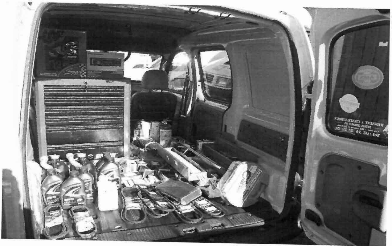
Prilog 2. Unutrašnji izgled vozila za pomoć na putu