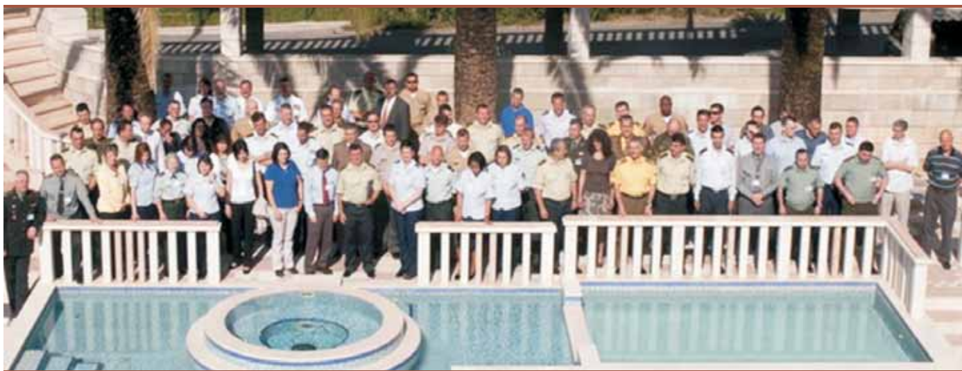
Finalna planska konferencija Budva, maj 2010.

Rukovodstvo vježbe detaljno planira i priprema dokumenta potrebna za vrhunsku