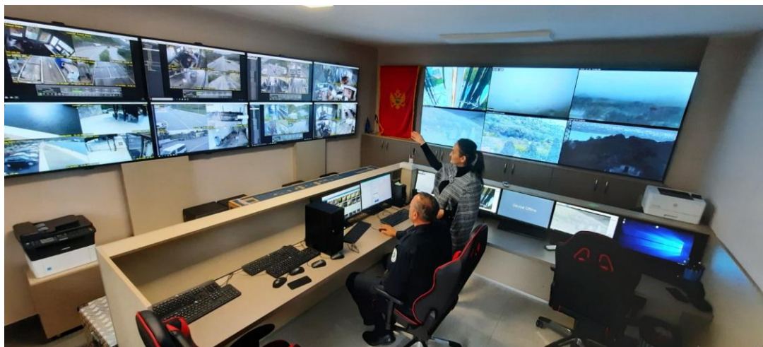
Koordinacioni centar Podgorica

Takođe, tokom godine u Koordinacionom centru su se obavljali poslovi iz oblasti saradnje sa FRONTEX-om, i to: dnevno ažuriranje stanja bezbjedonosnih incidenata iz nacionalne situacione slike u specifičnu situacionu sliku kroz njihovo prevođenje na engleski jezik, tj. JORA aplikaciju (ukupno 2600 događaja); dnevno izvještavanje sa nacionalnog nivoa o nezakonitim prelascima državne granice kroz FRONTEX-ovu JORA aplikaciju (i pokušajima istih), sprovedenim readmisijama, izraženim namjerama ili zvanično podnešenim aplikacijama za azilom, kao i evidentiranom nezakonitom boravku; obrada podataka o ilegalnoj migraciji, prekograničnom kriminalu na mjesečnom nivou, kroz CIRCAB WBRAN platformu; koordinacija pod okriljem zajedničkih aktivnosti sa FRONTEX-om, sa nivoa LCC centra.