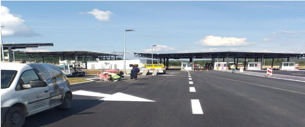
Novoizgrađeni granični prelaz Ranče, na putnom pravcu Pljevlja-Prijepolje

Takođe, u Ulcinju je otvoren privremeni granični prelaz za pomorski međunarodni putnički saobraćaj na pristaništu u Ulcinju, u periodu od 12. jula do 30. septembra 2023. godine. Otvaranje ovog graničnog prelaza ima za cilj poboljšanje kako turističke privrede, tako i bolje povezanosti sa susjedima.