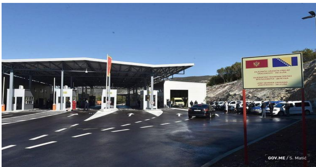
Zajednički granični prelaz Vraćenovići – Deleuša

U cilju unapređenja granične infrastrukture postignut je određeni napredak. Sredstvima SBP, izgrađen je Zajednički granični prelaz Vraćenovići–Deleuša između Crne Gore i BiH, na putnom pravcu Nikšić-Bileća, koji je počeo da funkcioniše 20. oktobra 2020. godine.