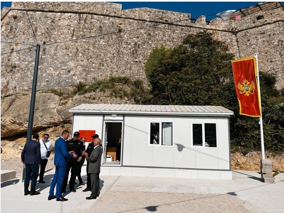
Privremeni granični prelaz za pomorski međunarodni putnički saobraćaj na pristaništu u Ulcinju

Takođe, u Ulcinju je otvoren privremeni granični prelaz za pomorski međunarodni putnički saobraćaj na pristaništu u Ulcinju, u periodu od 12. jula do 30. septembra 2023. godine. Otvaranje ovog graničnog prelaza ima za cilj poboljšanje kako turističke privrede, tako i bolje povezanosti sa susjedima.