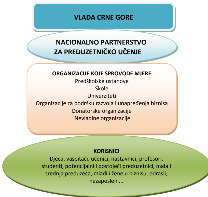
Grafik 1: Struktura ključnih zainteresovanih strana za cjeloživotno preduzetničko učenje

U sistemu izvršne vlasti, ključnu ulogu ima Ministarstvo ekonomije (u daljem tekstu MEK) tj. Direktorat za investicije, razvoj malih i srednjih preduzeća i upravljanje EU fondovima, koji je zadužen za kreiranje i praćenje sprovođenja Strategije za cjeloživotno preduzetničko učenje 2020-2024. godina. U prethodnom periodu njeno kreiranje i praćenje sprovođenja bili su u nadležnosti bivše Direkcije za razvoj malih i srednjih preduzeća, koja je u periodu donošenja prve Strategije za cjeloživotno preduzetničko učenje