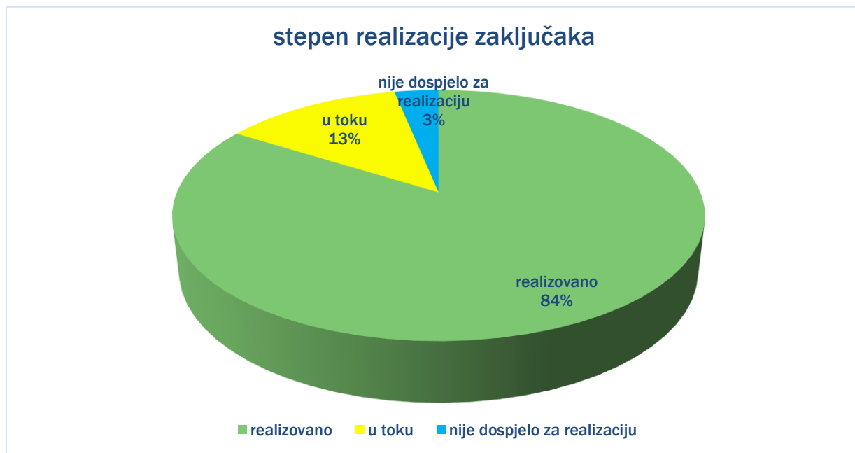
Grafik 2. Stepen realizacije zaključaka

U toku 2022. godine Savjet je razmatrao 15 dokumenata/tema i to: 2 preloga zakona, 1 poslovnik, 1 planski dokument, 1 metodologiju, 8 dokumenata/tema izvještajnog tipa i 2 inicijative.