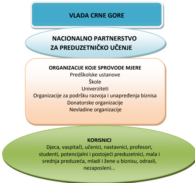
Grafik 1: Struktura ključnih zainteresovanih strana za cjeloživotno preduzetničko učenje

U sistemu izvršne vlasti, ključnu ulogu ima Ministarstvo ekonomije (u daljem tekstu MEK), tj. Direktorat za investicije, razvoj malih i srednjih preduzeća i upravljanje EU fondovima, koji je zadužen za kreiranje i praćenje sprovođenja Strategije za cjeloživotno preduzetničko učenje 2020-2024. godina. U prethodnom periodu njeno kreiranje i praćenje sprovođenja bili su u nadležnosti bivše Direkcije za razvoj malih i srednjih preduzeća, koja je u periodu donošenja prve Strategije za cjeloživotno preduzetničko učenje 2008-2013. godina, važila za ključnu nacionalnu instituciju za kreiranje i implementaciju politike MSP, sa raspoloživim operativnim i programskim resursima i mrežom lokalnih i regionalnih biznis centara.