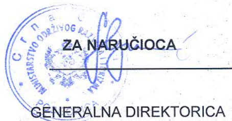
GENERALNA DIREKTORICA Sanja Lješević