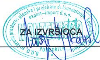
IZVRŠNI DIREKTOR Igor Đukanović

Ovaj ugovor je pravno valjano zaključen i potpisan od dolje navedenih ovlašćenih zakonskih zastupnika strana ugovora i sačinjen je u 6 (šest) istovjetnih primjeraka, od kojih su dva (2) primjerka za Izvršioca, a ostala četiri (4) za potrebe Naručioca.