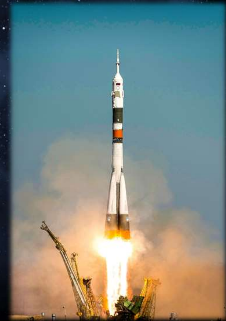
Soyuz raketa - ilustracija