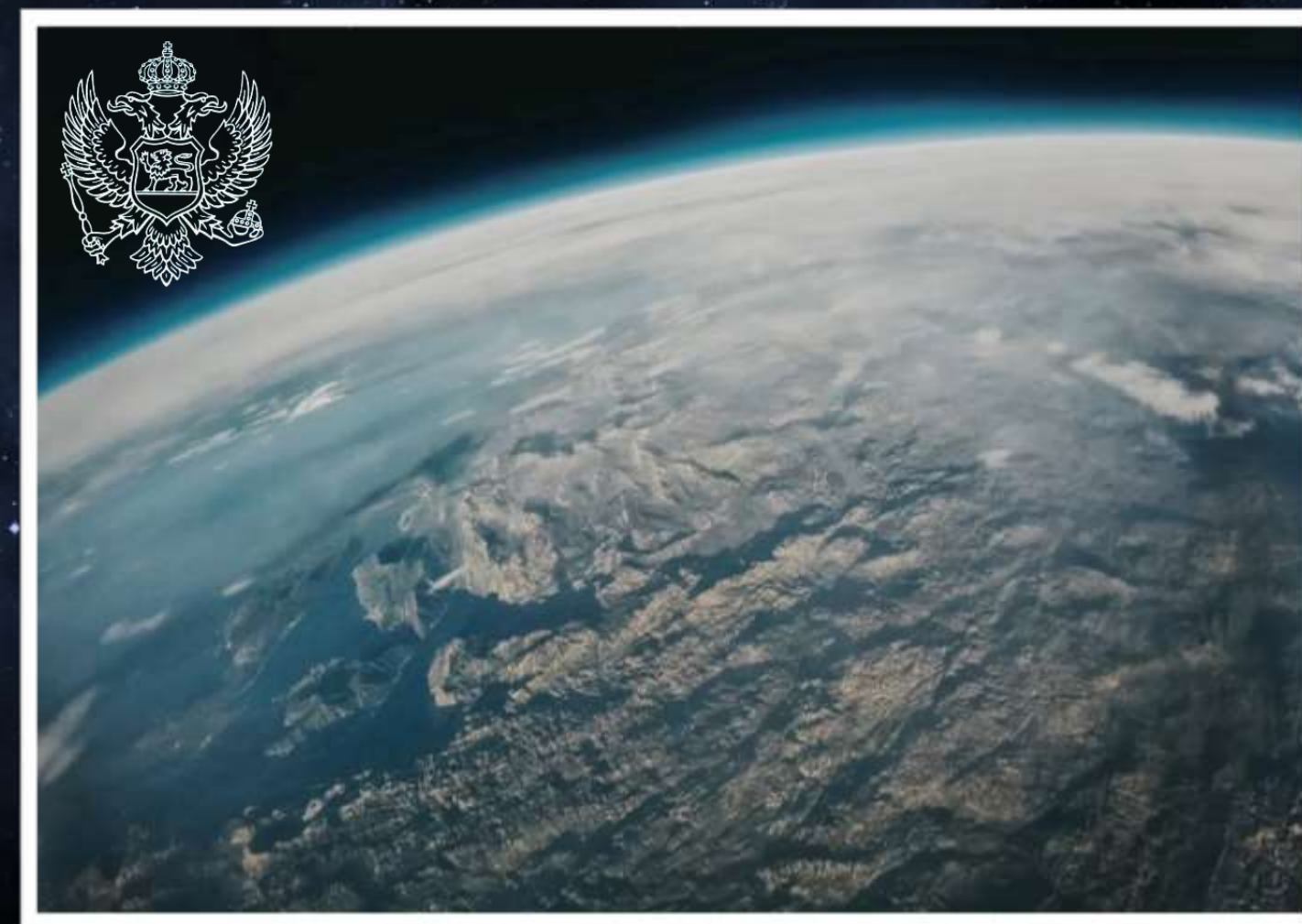
Fotografija koju je zabilježila kamera na payload-u