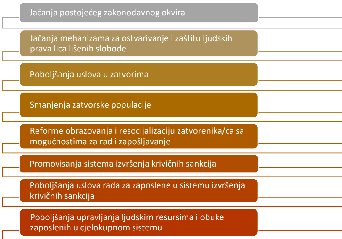
Grafik 1: Osnovni pravci djelovanja strateškog dokumenta

Sistem izvršenja krivičnih sankcija u Crnoj Gori predstavlja složenu mrežu nezavisnih, ali istovremeno i međusobno zavisnih insitucija. Kao sistem, različite institucije zajednički rade u cilju: