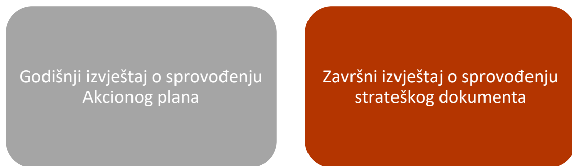
Grafik br. 9: Sistem izvještavanja

Osnovne nadležnosti operativnog tijela se ogledaju u pripremi dvije vrste izvještaja, i to: