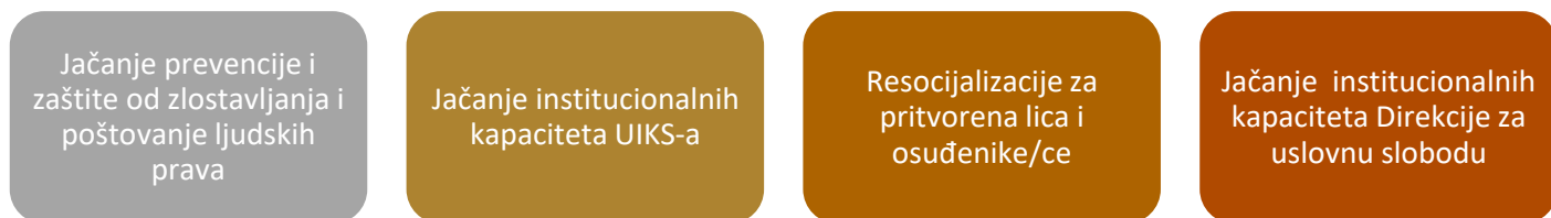
Grafik 2: Oblasti strateškog dokumenta

Cilj novog strateškog dokumenta je da nastavi sa reformom započetom kroz prethodnu strategiju, primarno kroz dalje unapređenje međusektorske saradnje, jačanje efikasnosti cjelokupnog sistema, gdje će dominantan akcenat biti na sljedećim oblastima: