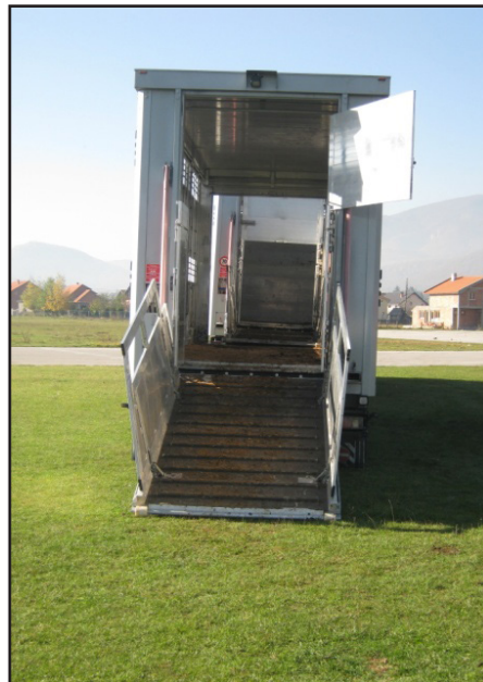
Rampa za utovar životinja

Za životinje je obično najstresniji dio puta ukrcavanje i iskrcavanje. Tu treba preduzeti posebne mjere, kao što su: