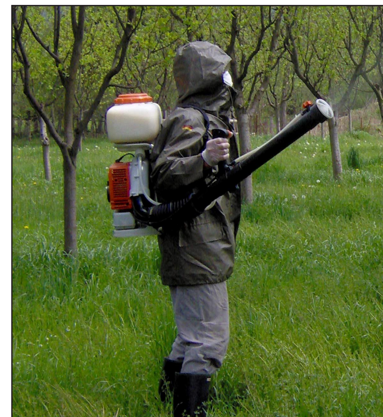
Primjena pesticida u voćnaku

Posebnu zaštitnu odjeću koja se koristi prilikom rukovanja pesticidima (npr. rukavice, zaštitno odijelo i maska protiv prašine ili respirator) treba koristiti samo u tu svrhu, i držati je na zaključanom mjestu van domašaja djece, životinja i daleko od hrane za životinje ili ljude, tj. u ili blizu magacina za pesticide.