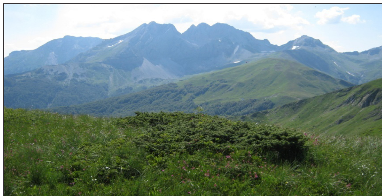
Šipražje u pašnjaku

Prirodne travnate površine treba održavati na način da se na njima vrši uzgoj dovoljnog broja grla stoke, kako bi se spriječio rast šipražja. Kao opšte pravilo, potrebno je najmanje 0,15 uslovnih grla stoke po hektaru, kako bi se spriječio razvoj šipražja. Ukoliko je koncentracija životinja po jedinici površine manja od navedene (0,15 UG po ha), onda pašnjak treba kositi ili potkresivati jednom godišnje, kako bi se suzbio razvoj šipražja i održale produktivne trave.