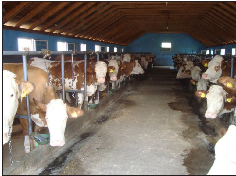
Vezani sistem držanja goveda