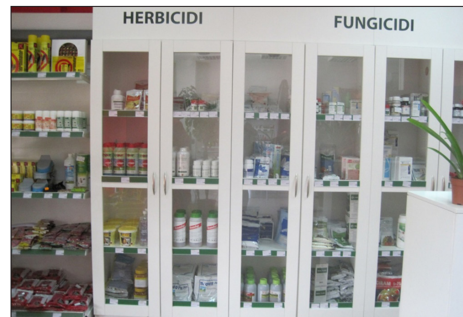
Pravilno čuvanje pesticida

Pesticide uvijek treba držati u njihovom originalnom pakovanju, a nikada u drugoj ambalaži, kao što su stare flaše, budući da je to uzrok mnogih fatalnih slučajeva trovanja.