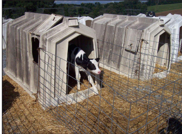
Prikladan prostor za držanje teladi

Gazdinstva sa pet ili manje teladi izuzeta su od nekih od ovih posebnih uslova u pogledu veličine boksova.