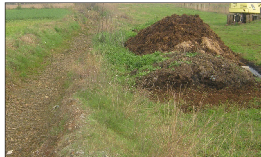
Nepravilno odlaganje čvrstog stajnjaka

Objekte za stoku treba projektovati i locirati tako da se tečno đubrivo i voda koja otiče zaustavi i ne zagađuje površinske i podzemne vode. Savjeti o projektovanju i lokaciji objekata za stoku mogu se dobiti od Službe za selekciju stoke.