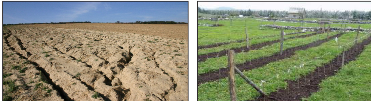
Primjeri dobro i loše održavanog zemljišta