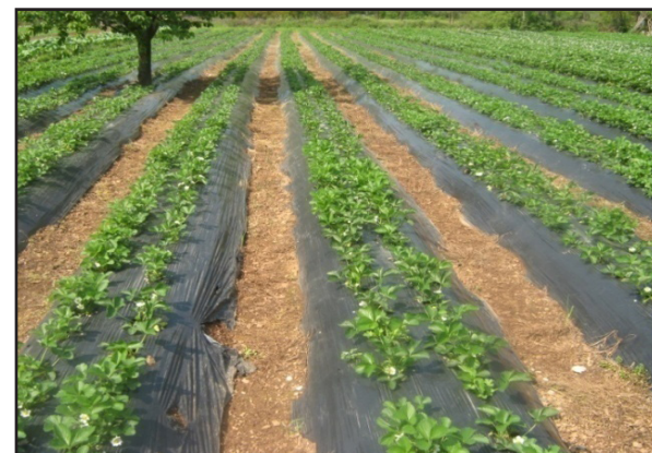
Zaštita zasada od korova

Treba preduzeti sve neophodne korake kako bi se izbjegla oštećenja ovih staništa.