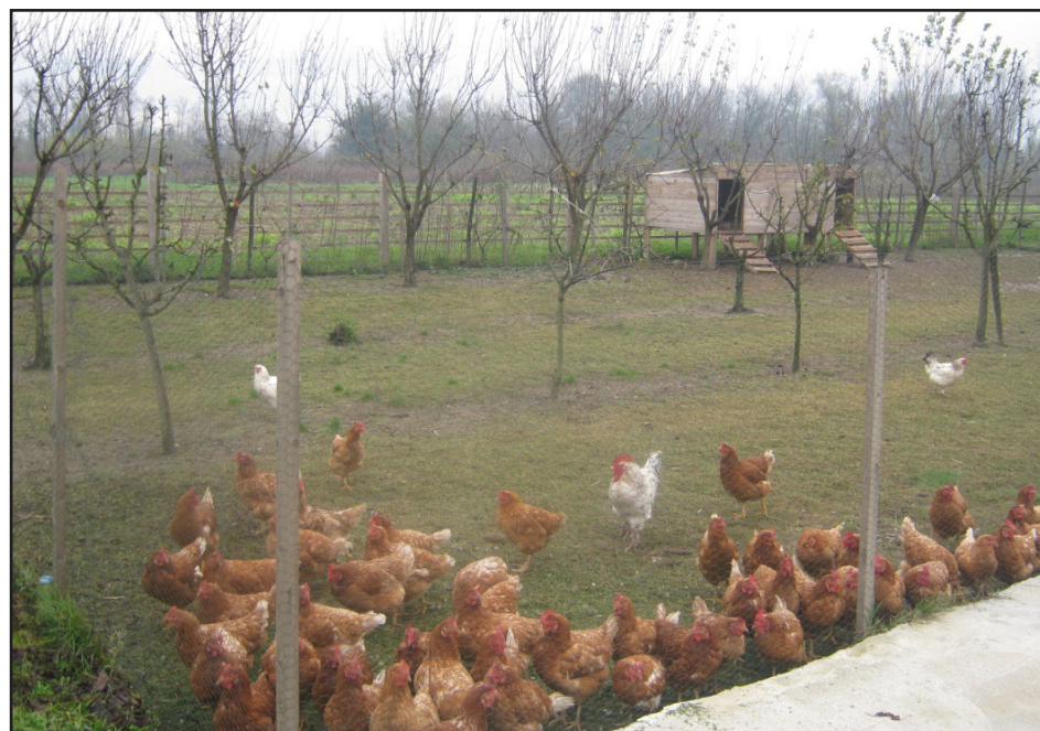
Slobodan sistem držanja kokošaka

Pod mora da bude od odgovarajućeg materijala koji ne ometa aktivnosti i fiziološke potrebe koka nosilja.