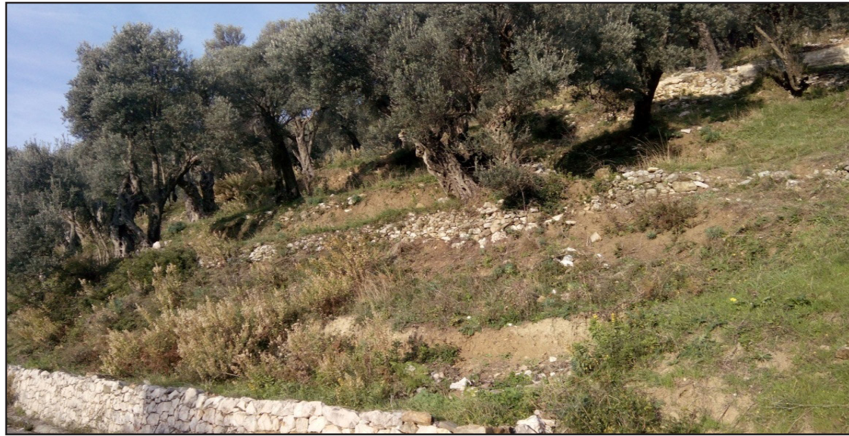
Primjer maslinjaka na nagibu gdje je potrebna zaštita od erozije, Valdanos, Ulcinj.

Ukoliko se zasad podiže duž padine, iz određenih razloga, onda između redova treba ostaviti travu da raste, kako bi se spriječila erozija. Kod ovakvih zasada, kada uništavanje korova postane neophodno, treba koristiti herbicide, a izbjegavati obradu zemljišta, kako bi korijenje trave ostalo u zemljištu, vezalo zemljište i spriječilo eroziju.