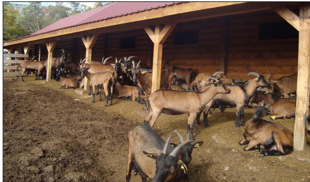
Advekatan smještaj za koze