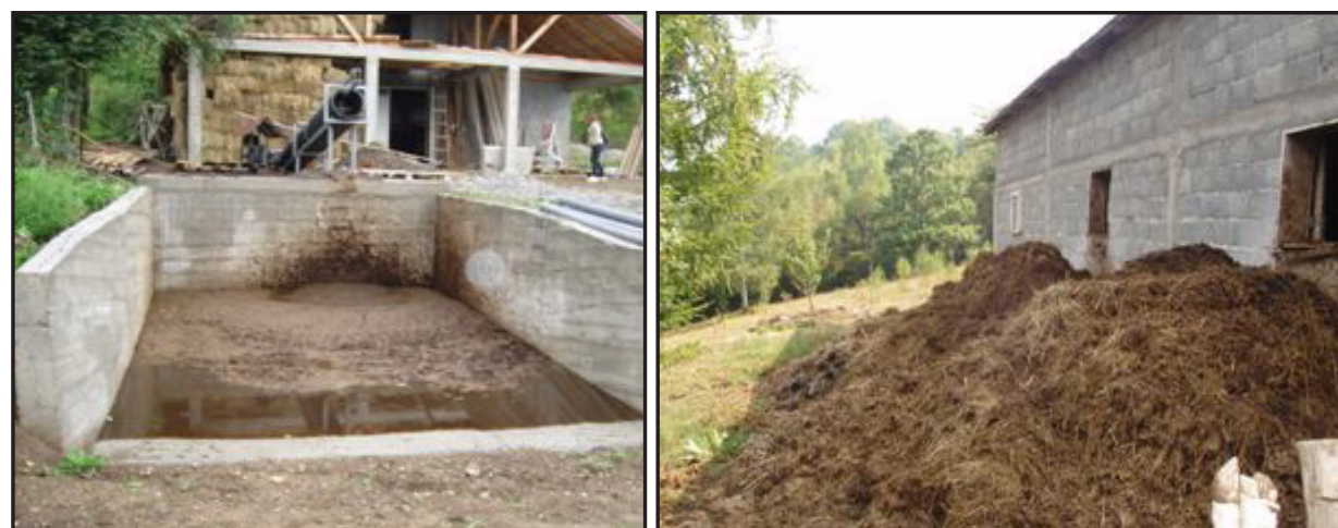
Dobar i loš primjer odlaganja stajnjaka