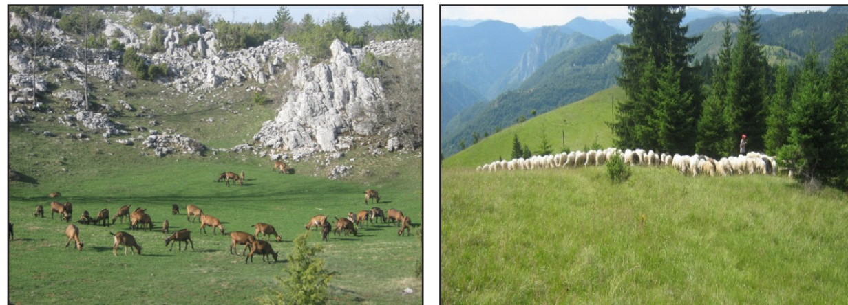
Koze i ovce na paši

Naročito bitan uslov za ovce i koze koje se drže u planinskim oblastima je da im se obezbijedi zaštita od loših vremenskih uslova i predatora kao što su vukovi, kao i da im se obezbijedi neophodna zdravstvena zaštita.