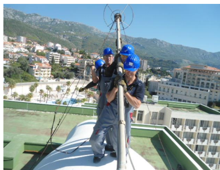
Slika 2: Uklanjanje radioaktivnog gromobrana sa hotela Mediteran u Bečićima

Sigurno i bezbjedno upravljanje radioaktivnim izvorima zračenja je osnovna aktivnost kojom se postiže očuvanje i zaštita života i zdravlja sadašnjih i budućih generacija i zaštita životne i radne sredine. Važno je istaći da je Crna Gora sopstvenim kapacitetima implementirala najzahtjevniju fazu projekta-skidanje, prevoz (transport) i skladištenje radioaktivnih gromobrana i iskorišćenih zatvorenih radioaktivnih izvora.