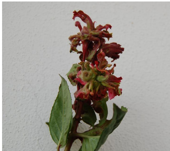
Simptomi napada A. fuchsiae na fuksiji