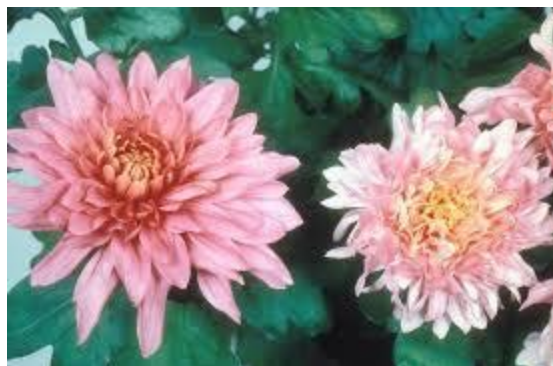
Simptom izbjeljivanja na cvijetu hrizanteme