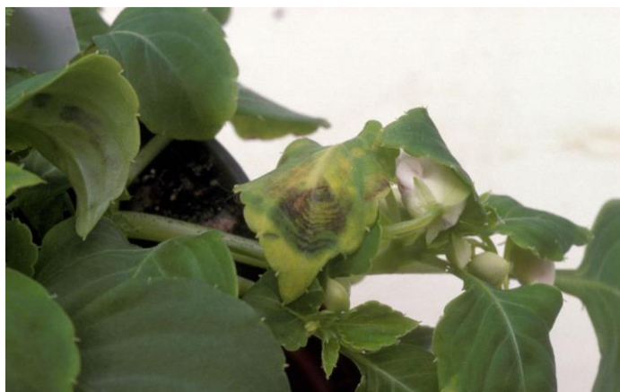
Pojava smeđe-ljubičastih koncentričnih pjega na listu impatijensa

Simptomi su vrlo slični simptomima koje uzrokuje TSWV. Jačina zaraze, domaćin, sorta, starost biljke, temperatura i intenzitet svjetlosti utiču na izgled simptoma. Ponekad se simptomi mogu zamijeniti sa simptomima nedostatka ili viška hranljivih elemenata ili kao fitotoksična reakcija biljke. Simptomi se najčešće uočavaju na listovima u obliku deformacije, žućenja, pojave smeđe-ljubičastih pjega ili koncentričnih i nekrotičnih prstenova. Lisni nervi mogu izgubiti boju ili nabubriti, a moguća je i pojava lisnog mozaika. Simptomi se mogu pojaviti na stabljici i cvjetovima. Ukoliko se virus pojavi šteta koju uzrokuje je potpuna s obzirom da zaražene biljke nisu tržišno prihvatljive i ne mogu se koristiti za dalju vlastitu proizvodnju sjemena ili sadnog materijala.