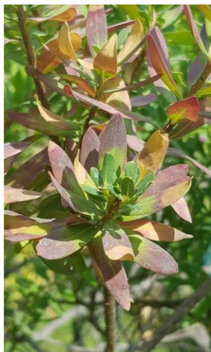
Simptomi zaraze na poligali

Potencijalni vektori bakterije su cikade - Philaenus spumarius , Philaenus italosignus i Neophilaenus campestris . Najčešći vektor Philaenus spumarius je polifagan insekat čije larve se na proljeće mogu pronaći na livadskim biljkama - korovima iz porodica Asteraceae, Fabaceae i Apiaceae. Odrasli se sele sa livadskih biljaka na drvenaste kulture.