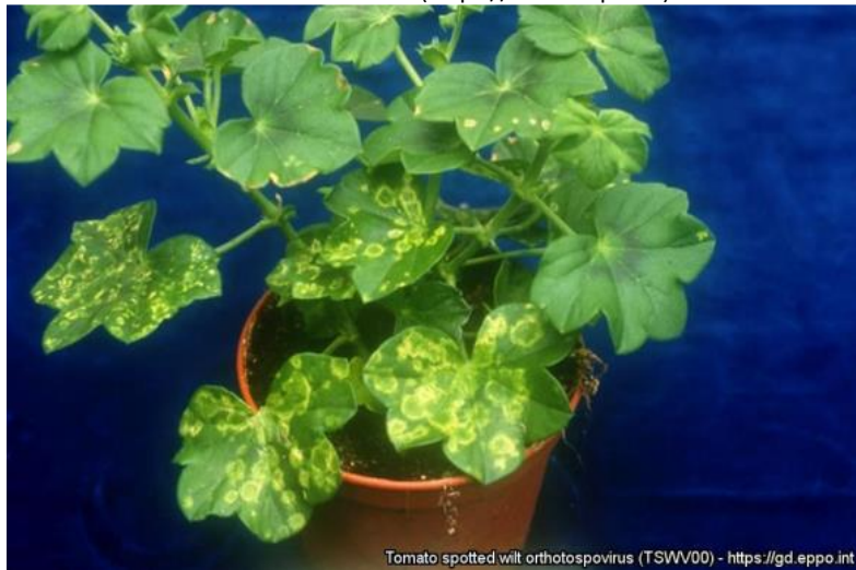
Tomato spotted wilt orthotospovirus (TSWV/00) - https://gd.eppo.int