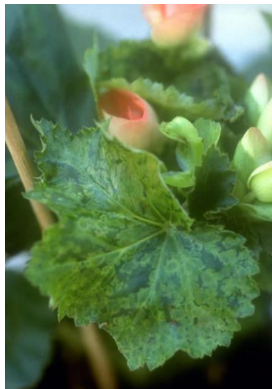
TSWV na begoniji https://gd.eppo.int/