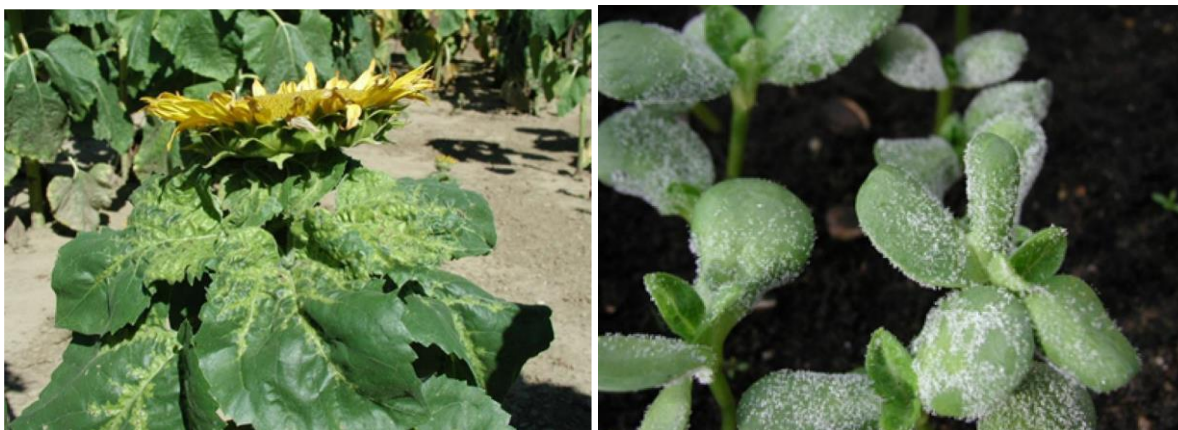
Sistemično zaražena biljka suncokreta - P. halstedii

Simptomi su patuljasti i deformisani rast stabljike i glave suncokreta s obilnom fruktifikacijom patogena na naličju listova i hlorotično-zelenom promjenom boje na gornjoj strani zaraženih listova, koja se širi od glavnog nerva. Drugi tip simptoma vidljiv je kotiledonima kao bijela „prašina“ koja se sastoji od obilne sporulacije P. halstedii (sporangiofore i sporangije). Treći tip simptoma predstavlja sekundarnu infekciju kad zaraza prelazi sa sistemično zaraženih biljaka na druge biljke i mogu se vidjeti obično sitne, uglate, hlorotično zelene pjege na licu lista, ograničene lisnim nervima, na naličju su bijele boje zbog micelije i obilja spoangija.