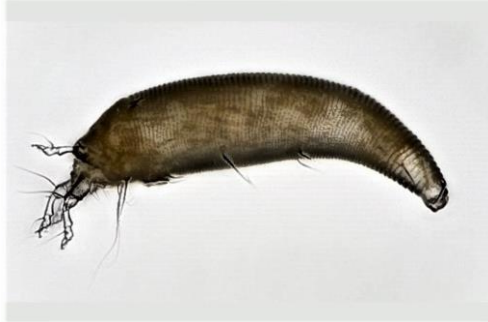
A. fuchsiae

Napada samo biljke iz roda Fuchsia i uzrokuje na biljkama rđavost i deformaciju listova. Listovi nabubre i poprimaju crvenkastu boju (slično kao kod zaraze patogenom gljivicom Taphrina deformans , koja izaziva kovrdžavosti lista breskve). Cvjetovi uslijed jakog napada također mogu biti deformirani, a na kraju dolazi i do potpunog stopiranja rasta biljke.