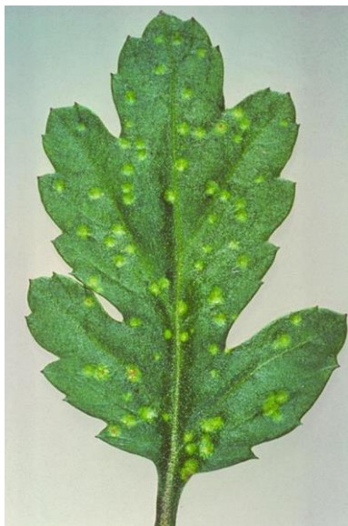
P. horiana na listu hrizanteme