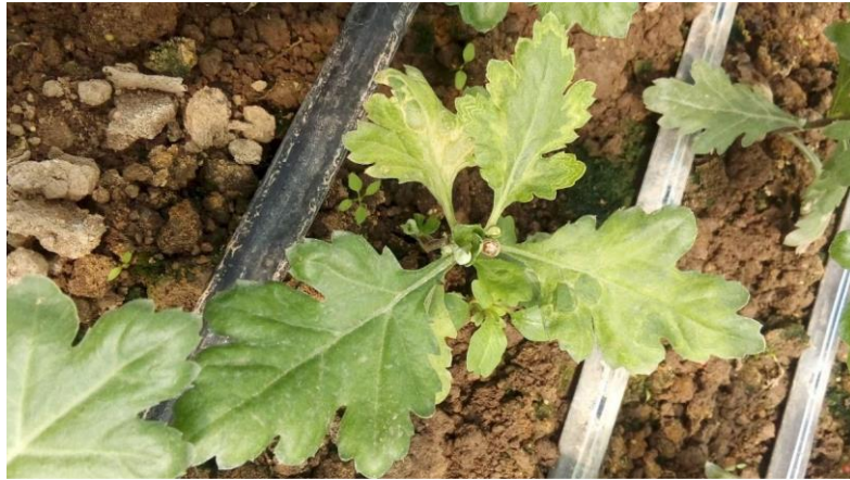
TSWV na hrizantemi ( https://www.hapih.hr )