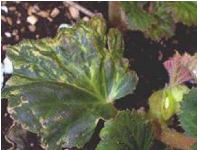
Deformacije listova i pojava koncentričnih krugova na begoniji