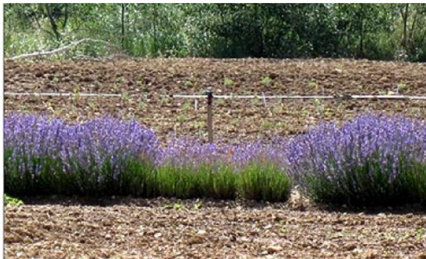
Simptomi propadanja lavande