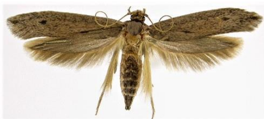
Leptir O. sacchari

Početni simptomi ubušivanja prvih razvojnih stadijuma gusjenica u drvenastim ili zeljastim stabljikama biljaka su vrlo teško uočljivi. Kasnije, zeljasti biljni dijelovi kao npr. kod kaktusa bivaju potpuno izbušeni. Na drvenastim biljkama, Dracena i Yucca gusjenice žive i hrane se u mrtvim i živim dijelovima korteksa i srži, uslijed čega napadnuto tkivo omekša. Prisustvo gusjenica kasnijih razvojnih stadijuma na biljci moguće je utvrditi po karakterističnoj „piljevini“ koja se pojavljuje na mjestima ubušivanja, a sastoji se od ostataka ishrane i izmeta. Gusjenice unište ksilem, lišće vene, otpada i cijela biljka propada. Ovakvi se simptomi mogu zamijeniti s fiziološkim poremećajima ili sa zarazom patogenim gljivama.