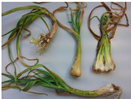
Simptomi i štete nematode Ditylenchus dipsaci na bijelom luku

Simptomi mogu varirati zavisno od biljke domaćina. Kod lukovica karakterističan znak napada D. dipsaci je deformacija lišća i lukovica popraćena nekrozama, stabljika i sama lukovica nabubre dok se lišće uvija i vene, zaražene lukovice često trunu u skladištu.