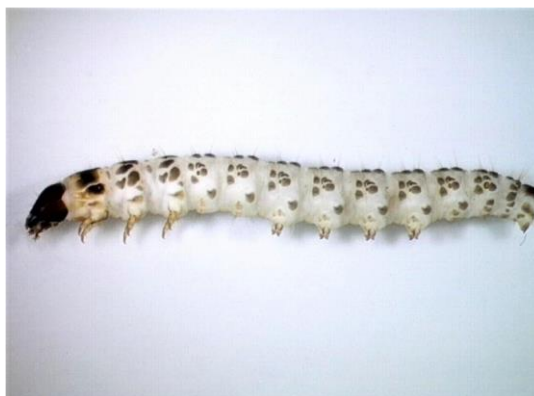
Gusjenica O. sacchari