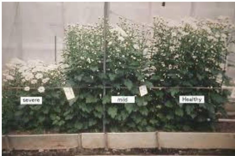
Biljke hrizanteme zaražene CSVd

Simptomi mogu biti promjenjivi i zavise od sorti i uslova sredine, posebno temperature i svjetlosti. Glavni simptom je zaostajanje u rastu, sa smanjenjem ukupne visine zrelih biljaka između 30 i 50% i lošim razvojem korijena. Ostali česti simptomi se manifestuju na cvijetu, jer zaražene biljke imaju smanjenu veličinu cvijeta i pokazuju prerano cvetanje, i do deset dana ranije. Kod određenih sorti, posebno crvenih, ružičastih ili bronzano obojenih, simptomi takođe mogu uključivati 'izbjeljivanje' (smanjenje intenziteta boje). Folijarni simptomi su rjeđi i često se vide samo kao manji, blijedi listovi a ponekad se uočavaju i mrlje na lišću ili fleke. Na nekim sortama mogu se pojaviti velike, žute mrlje na lišću.