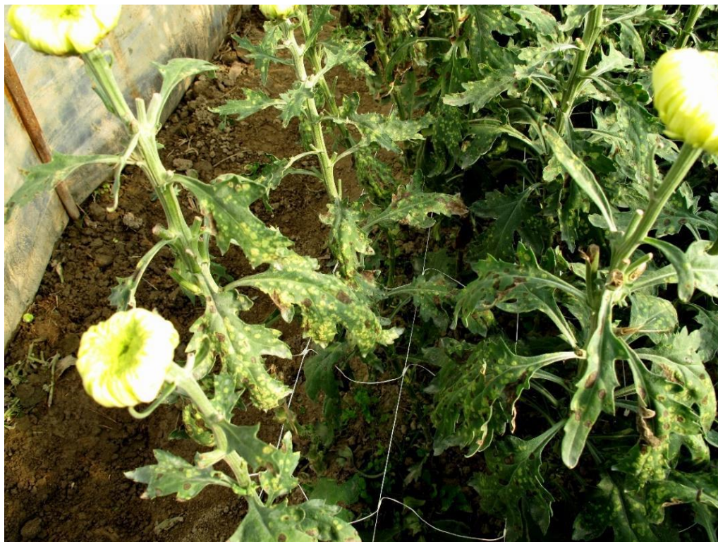
Jak napad bijele rđe na hrizantemi ( https://www.hapih.hr )