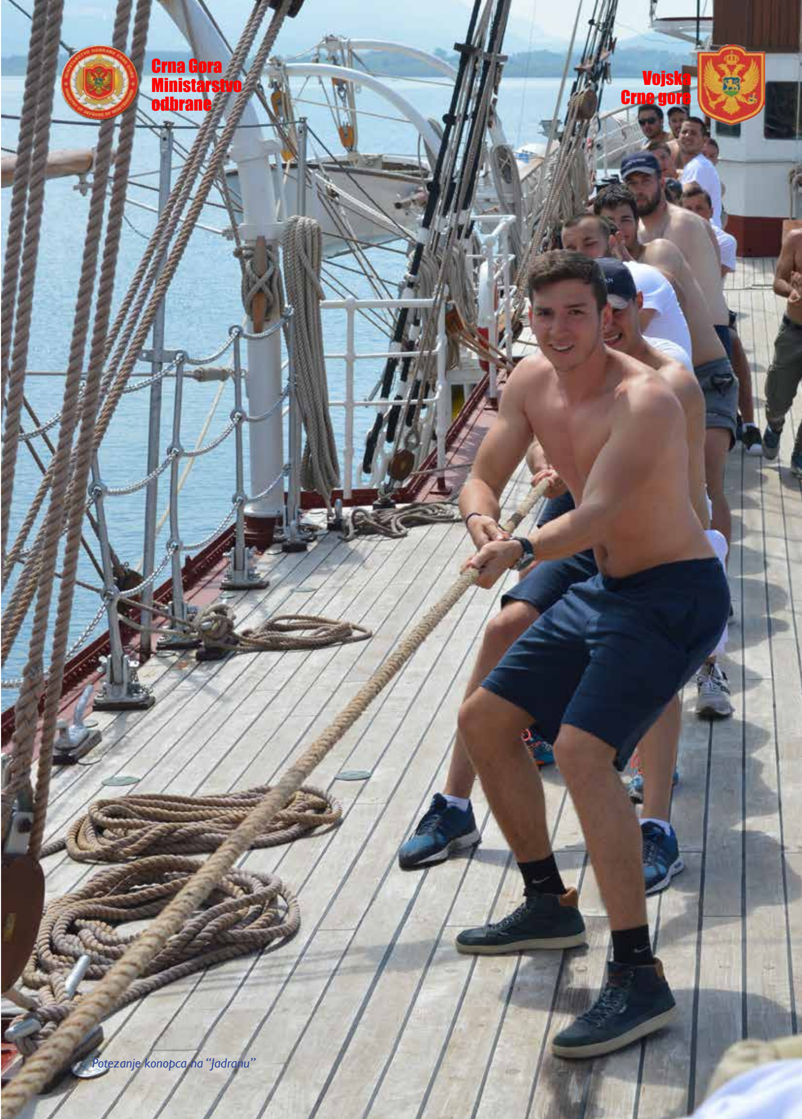
Potezanje konopca na "Jadrani"