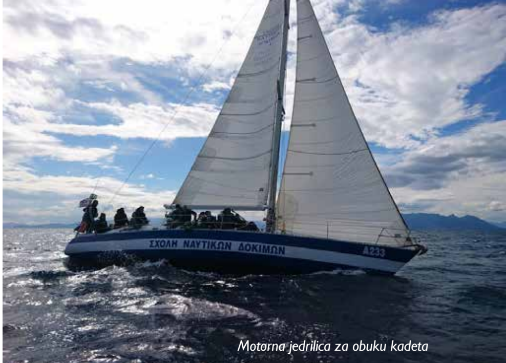
Motorna jedrilica za obuku kadeta

Kadeti svakodnevno imaju simulacije opštih uzbuna (kriznih situacija), obavljaju gađanje iz brodskih oružanih sistema i raznovrsnog vatrenog oružja. Zimska obuka se sastoji iz više kraćih ploidbi na brodovima, podmornicama