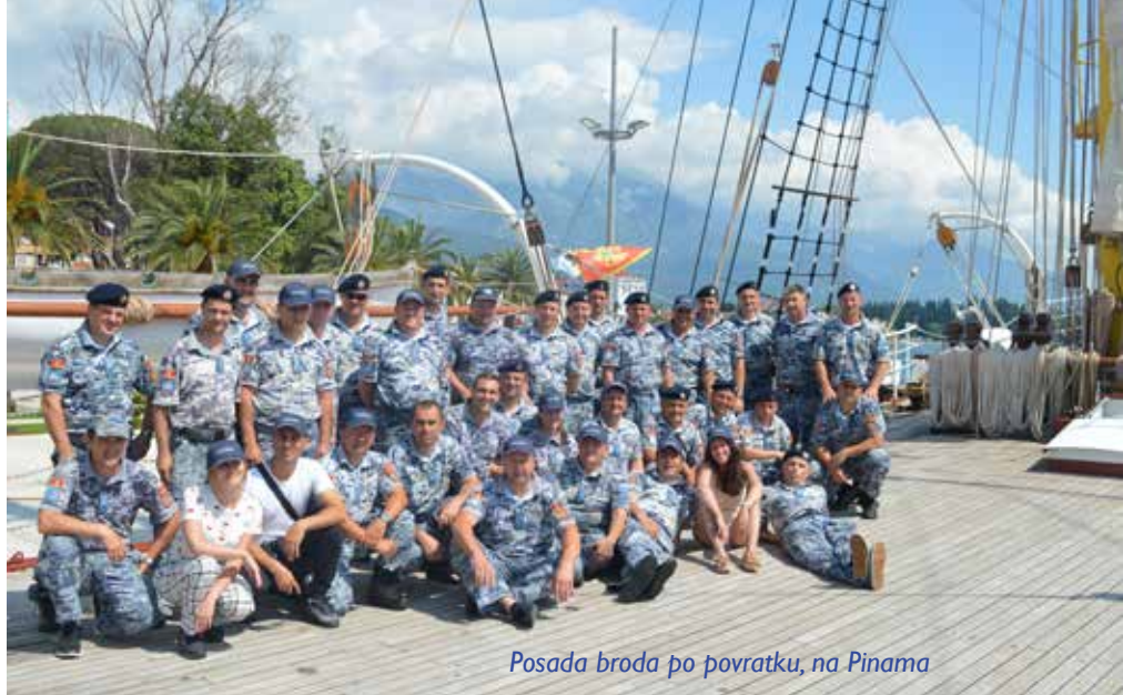
Posada broda po povratku, na Pinama

Valeta, Malta: Nakon nekoliko dana, stigli smo na Maltu, i uplovili u Veliku luku (The Grand Harbour) u Valeti. Malta se može obići za dobro organizovana tri dana. Ovo je poznata turistička destinacija, sve je podređeno turizmu. Jedrilice, otvorene terase, muzika... Svuda su motivi malteških vitezova a na