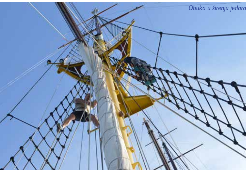
Obuka u širenju jedara