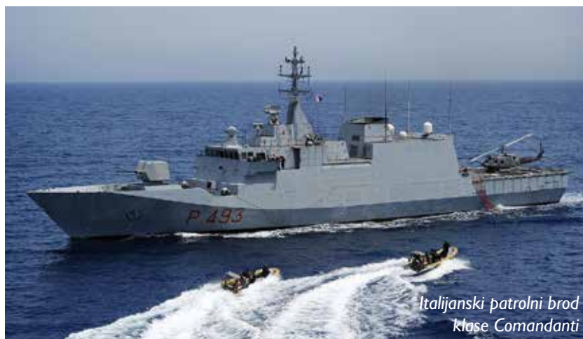
Italijanski patrolni brod klase Comandanti

Pramac sjekira u upotrebi kod Grka i Italijana: Brodovi holandskog brodogradilišta DAMEN, klase STAN PATROL 5009 i 5509 sa prepoznatljivim vertikalnim pramcem, tzv. pramac sjekira (eng. Axe bow) se nalaze u upotrebi Grčke obalske straže i Italijanske finansijske policije.