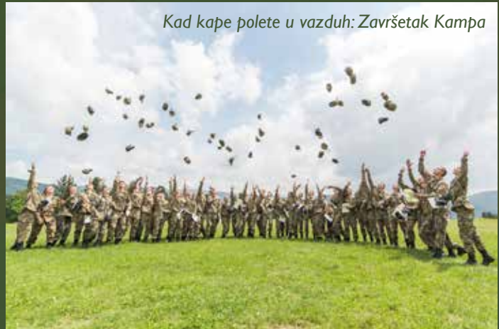
Kad kape polete u vazduh: Završetak Kampa