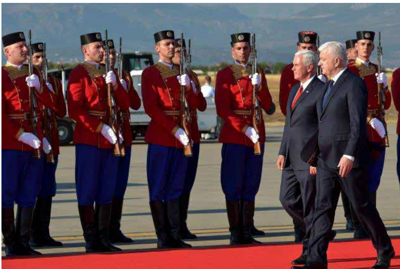
Na dočeku potpredsjednika Pensa, Golubovci, 1. avgust 2017.

Ljepota uniforme za gardiste je posebno bitna. Jer, oni su uvijek, i u svakoj državi pojam za stasitost, dostojanstveni i svečani stav, disciplinu i moć samokontrole.