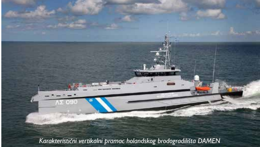
Karakteristični vertikalni pramac holandskog brodogradilišta DAMEN

Obalni ophodni brodovi za Hrvatsku obalsku stražu: U KU sastavu Obalne straže Republike Hrvatske, organizacijske cjeline Hrvatske Ratne mornarice, za