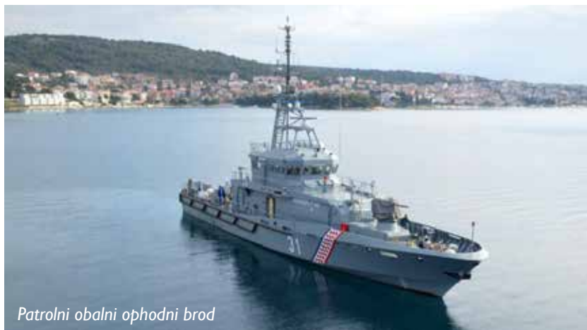
Patrolni obalni ophodni brod

sa brzinom od 13čv. Triglav je uveden u upotrebu 2010. godine, u sklopu izmirenja klirinškog duga Ruske Federacije. Sa ukrcajnih 63t goriva, opremljen brodskim desalinizatorom, te popunom artikala hrane, Triglav ima autonomiju od 7 dana na moru. Ovaj patrolni brod je opremljen sa protvbrodskim i PVO raketnim sistemom malog dometa ruske proizvodnje IGLA-2. Operativna upotreba broda je moguća do stanja mora 5, a zadovoljavajuća upravljivost do stanja mora 7. Slovenački mediji navode da je izgradnja i opremanje broda koštalo oko 45 miliona eura. Odgovarajući na zahtjev državnog vrha za angažovanje u međunarodnim misijama i operacijama na Mediteranu, Slovenska Vojska je tri puta upućivala brod Triglav , jednom u operaciju Italijanske Mornarice „Mare Nostrum“ i dva puta u operaciju Evropske unije EU NAVFOR MED.