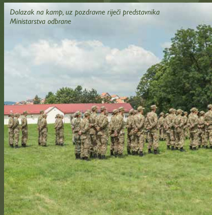
Dolazak na kamp, uz pozdravne riječi predstavnika Ministarstva odbrane