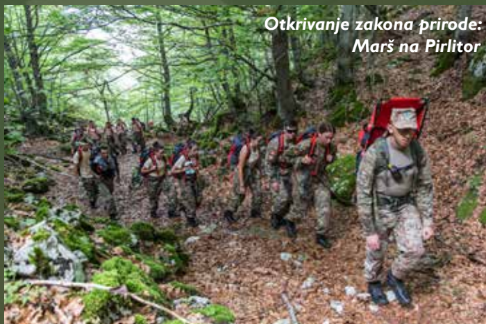
Otkrivanje zakona prirode: Marš na Pirlitor

Treći Ljetnji vojni kamp za mlade, koji organizuje Ministar