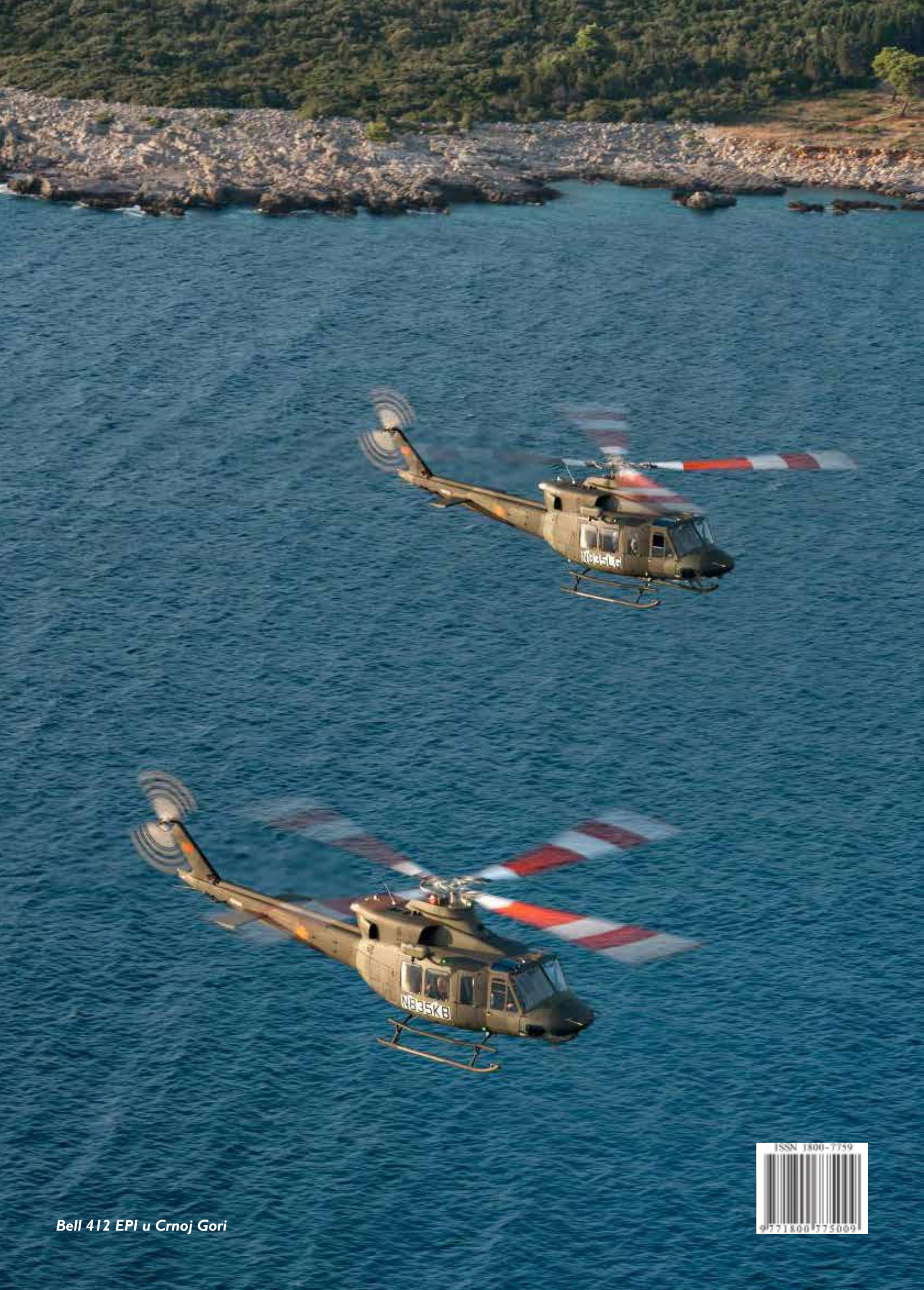
Bell 412 EPI u Crnoj Gori