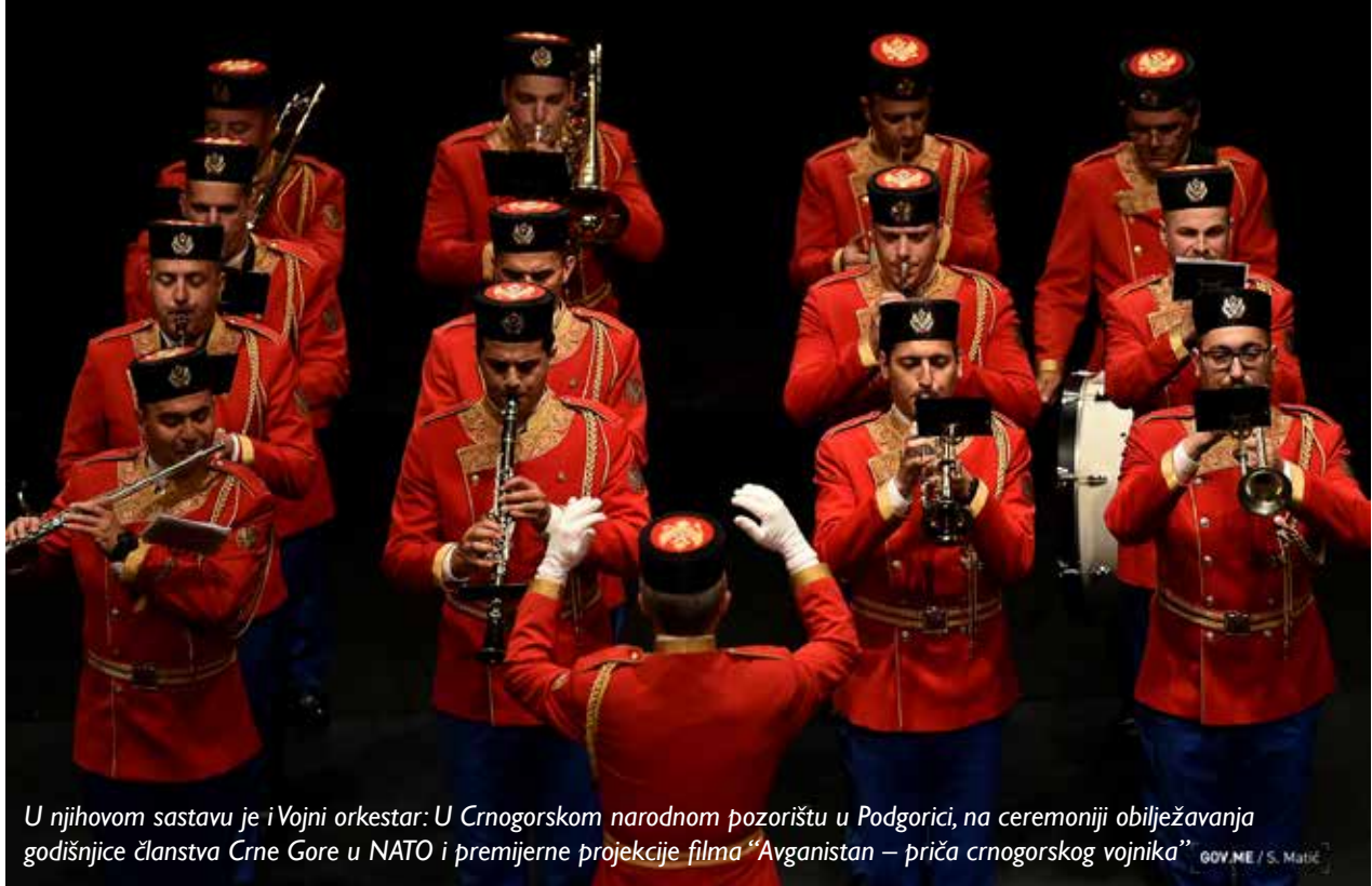
U njihovom sastavu je i Vojni orkestar: U Crnogorskom narodnom pozorištu u Podgorici, na ceremoniji obilježavanja godišnjice članstva Crne Gore u NATO i premijerne projekcije filma "Avganistan – priča crnogorskog vojnika"