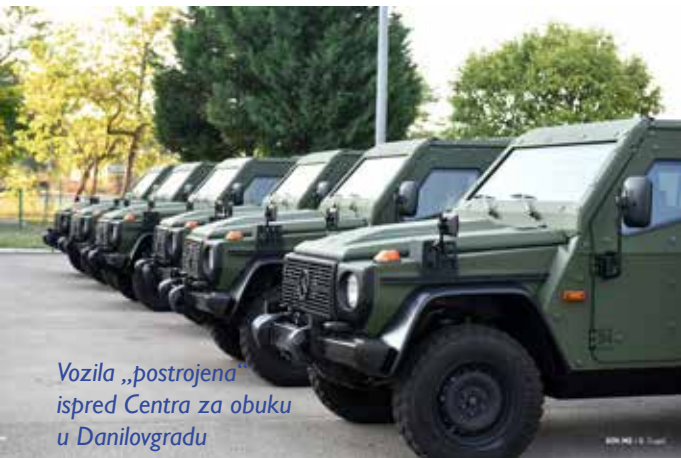
Vozila „postrojena“ ispred Centra za obuku u Danilovgradu

„Vojska Crne Gore ide ukorak sa razvojem savremenih tehnologija i izazova, sve sa jednim ciljem – da uspješno odgovorimo na postavljene misije i zadatke, i na taj način našim građanima omogućimo da se osjećaju sigurno i zaštićeno“, zaključio je general Dakić.