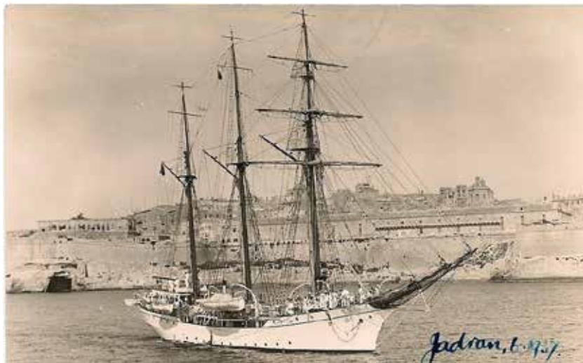
„Jadran“ na Malti 1937. na proputovanju za Port Said i Konstancu

Školski brod „Jadran“ izgrađen je u brodogradilištu „H.C. Stulcken & Sohn“ u Hamburgu, u Njemačkoj, 1933. godine, po narudžbi Mornarice Kraljevine Jugoslavije.