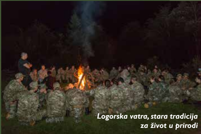
Logorska vatra, stara tradicija za život u prirodi

rstvo odbrane, ove godine realizovan je od 17. do 29. jula