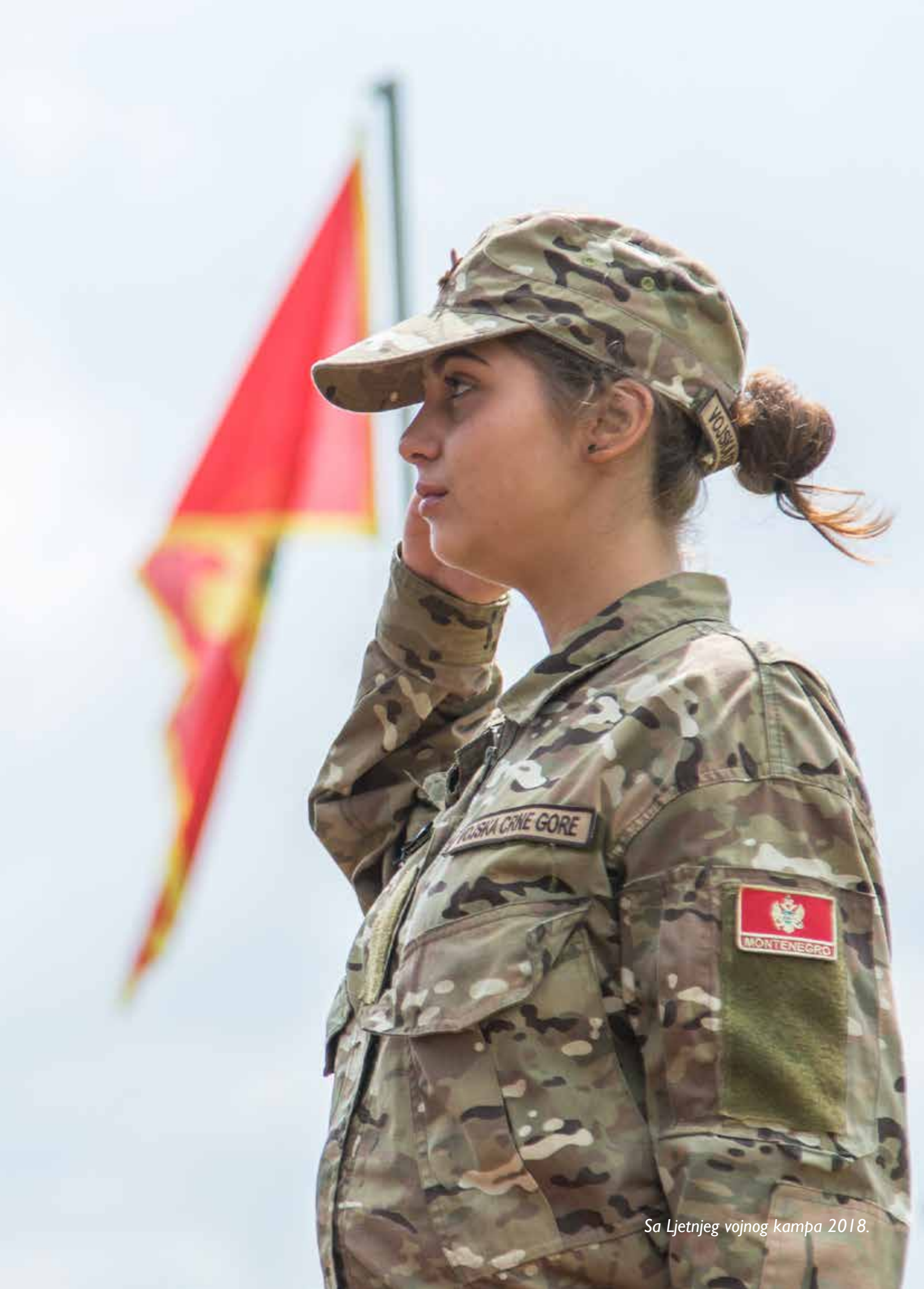
Sa Ljetnjeg vojnog kampa 2018.