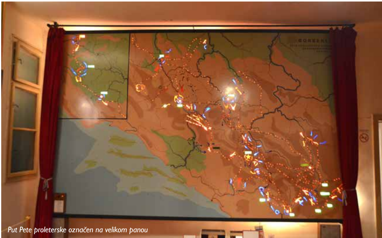
Put Pete proleterske označen na velikom panou

bila: „Ranjenike ne smijete ostaviti“. 3500 ranjenika, tifusara i drugih iznemoglih, Peta vodi sa sobom, uz neprekidne borbe i marševanje. Ranjenici su spašeni, uz 134 poginula borca i starješine.