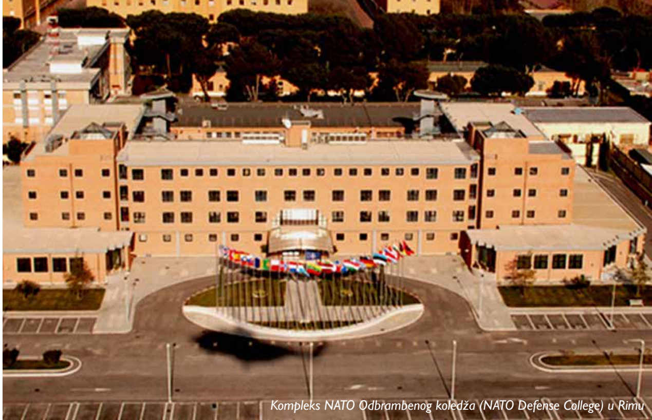
Kompleks NATO Odbrambenog koledža (NATO Defense College) u Rimu

i novinar je kazao: „Koja je razlika između škole i života? U školi dobijate lekciju, a zatim vam daju test. U životu dobijate test koji vas nauči lekciju.“