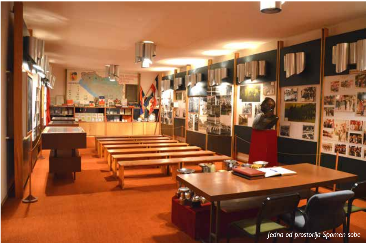
Jedna od prostorija Spomen sobe

Čuvena brigada, ponos Narodnooslobodilačke borbe, iznjedrila je 61 narodnog heroja. Nakon skoro epskog ratnog perioda, u doba SFRJ je više puta mijenjala svoje sjedište: Bitolj, Priština, Nikšić, i – na kraju, tadašnji Titograd. Tako su u podgoričkoj kasarni ostali vrijedni predmeti, oružje i dokumenta slavne „Savine brigade“