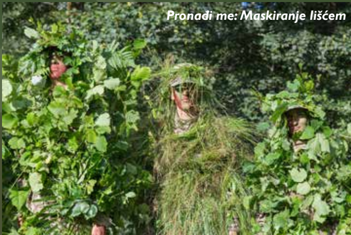
Pronađi me: Maskiranje lišćem