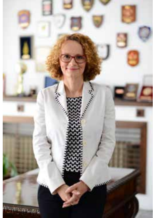
Makedonija je odgovoran član međunarodne zajednice

jer biti inspiracija ostalim zemljama u regionu da svi zajedno krenemo ka bezbjednoj i razvijenoj Evropi, zato što to naši građani to žele i zaslužuju.