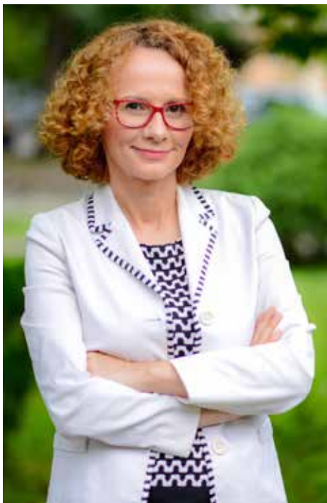
Crna Gora je školski primjer kako članstvo u NATO pozitivno utiče na državu: Ministarka Šekerinska

"Makedonski građani su evropski građani i dijele iste vrijednosti sa građanima zemalja članica NATO. Mi tamo i prirodno pripadamo. Makedonija, kao 30. zemlja članica NATO to će i pokazati, da smo dio naprednog demokratskog svijeta i da su nam blagostanje, sloboda i prava svake individue prioritet", kazala je makedonska ministarka odbrane u razgovoru za Partner . Ona je uvjeren da samo članstvo u NATO može zacementirati makedonsku nezavisnost, suverenitet i teritorijalni integritet.