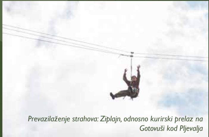
Prevazilaženje strahova: Ziplajn, odnosno kurirski prelaz na Gotovuši kod Pljevalja