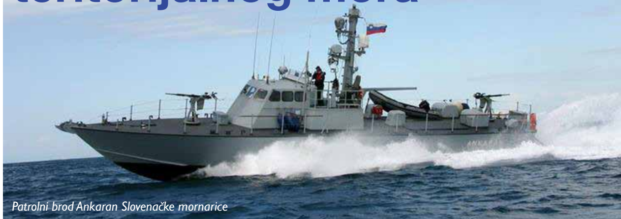
Patrolni brod Ankaran Slovenačke mornarice

U zavisnosti od zone upotrebe, ovi se brodovi mogu podijeliti u obalske patrolne brodove i patrolne brodove za otvoreno more. U Jadranskom moru, u zavisnosti od rejona izvršenja patrolnih zadataka, postoje različiti patrolni brodovi. Ovoj različitosti prvenstveno doprinose geografske karakteristike obalne države, kao i njene ambicije na moru