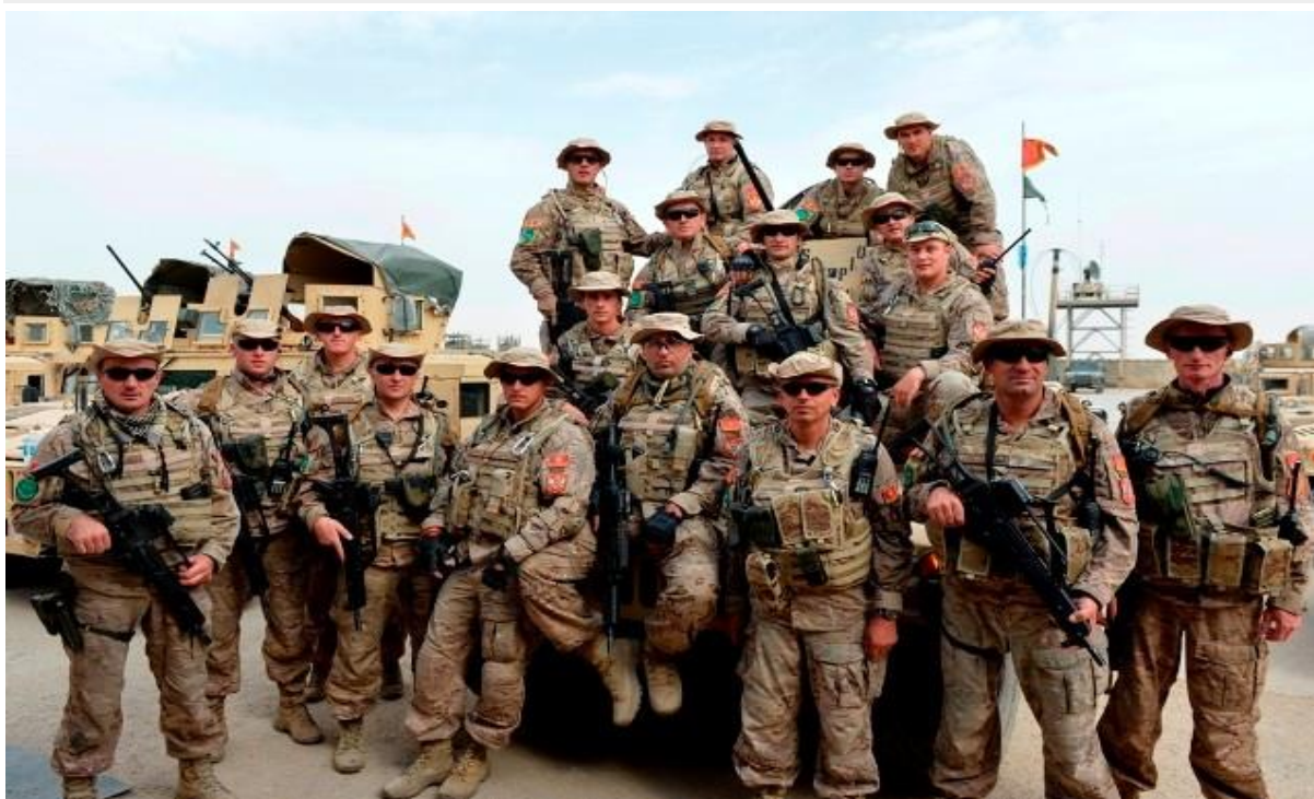
Pripadnici VII kontingenta

On je u razgovoru za Portal RTCG objasnio koje zadatke su naši momci u Avganistanu izvršivali, izazove sa kojima su se susretali, odnose sa lokalnim stanovništvom i kolegama i zašto se prijavio za sedmomjesečno služenje u toj zemlji.