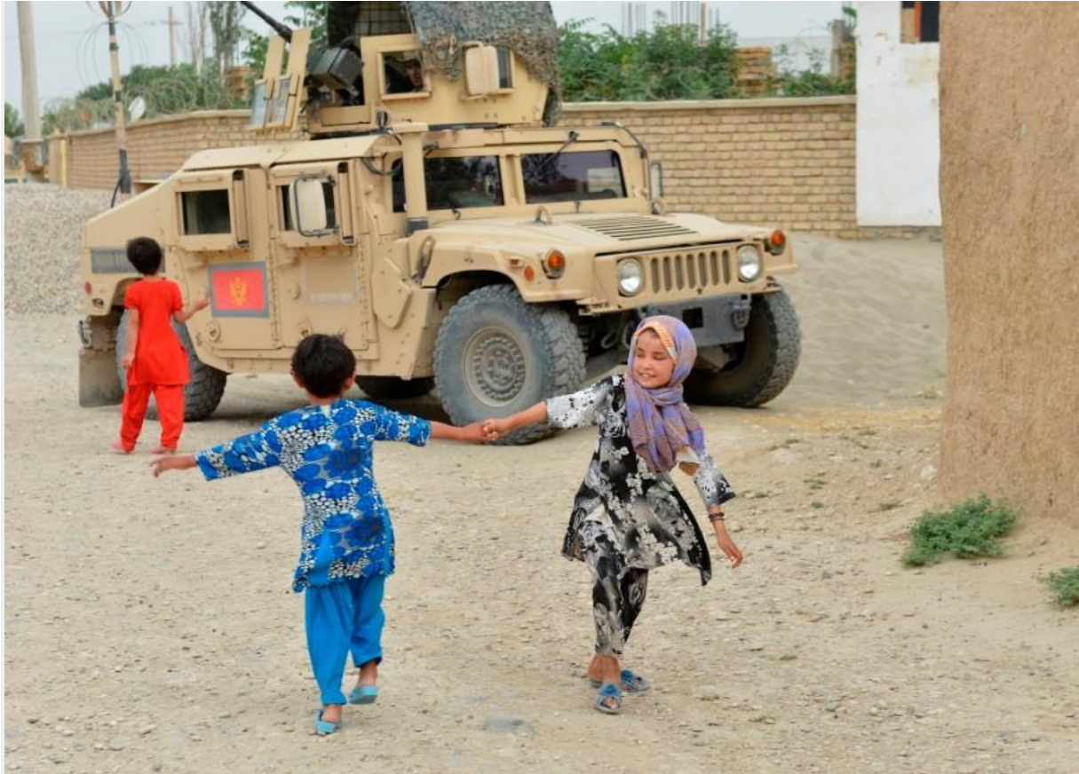
ISAF misija koristi Avganistancima

„Mijenja se svijest tog naroda. Sada većina njih koalicione snage smatra prijateljskim, jer one doniraju i pomažu u edukaciji i mnogim drugim oblastima, ne samo na bojnopolju. Naravno, ima loših momaka koji ne primjećuju to, ili ne žele da primjete“, precizira naš sagovornik.