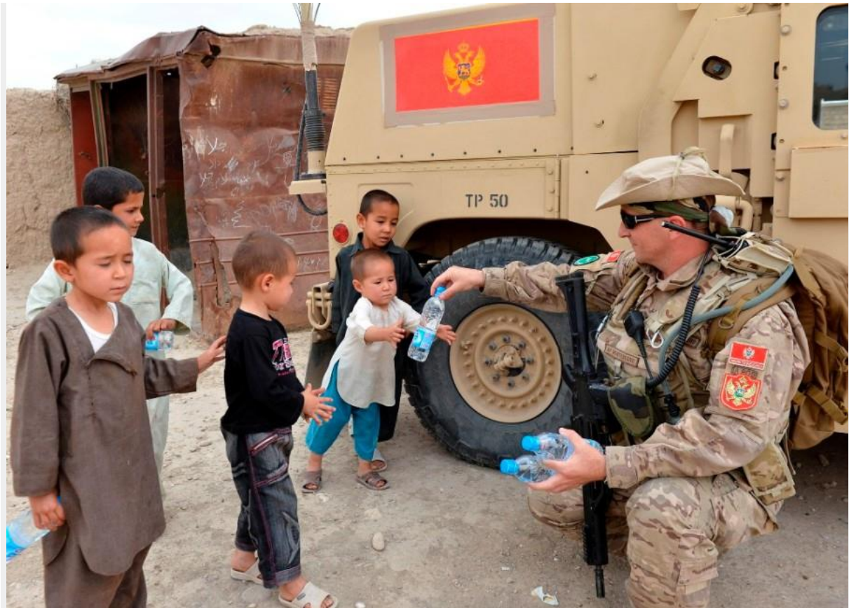
Naši vojnici su brzo postali omiljeni među mještanima