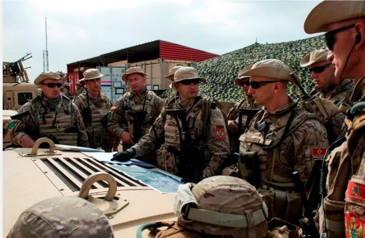
Detaljne pripreme pred patrolu

Pripadnici 7. kontingenta su prvi vojnici Crne Gore koji su išli u patrole van zidova baze, te je njima „borba“ s avganistanskom klimom pala najteže.