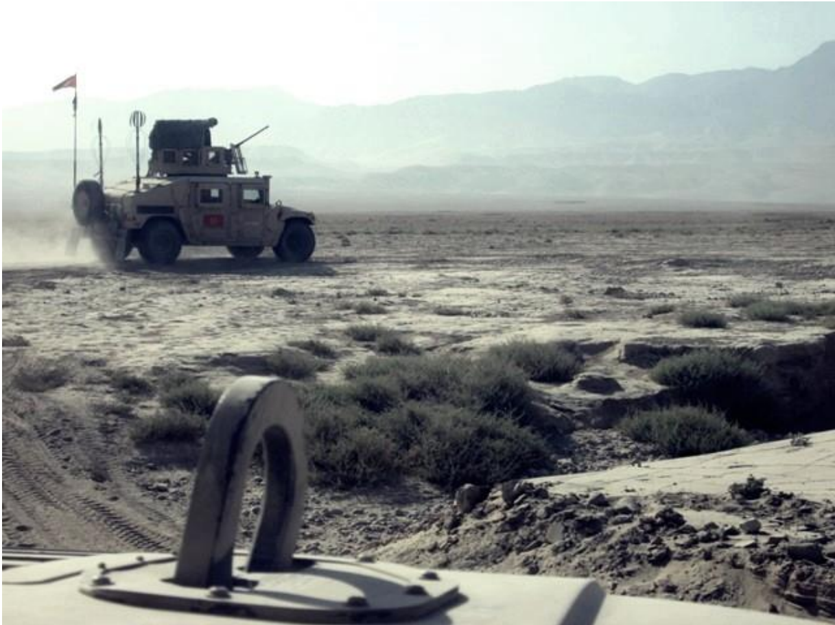
Vojnici Crne Gore su u patrolama van baze znali da borave i po 12 sati