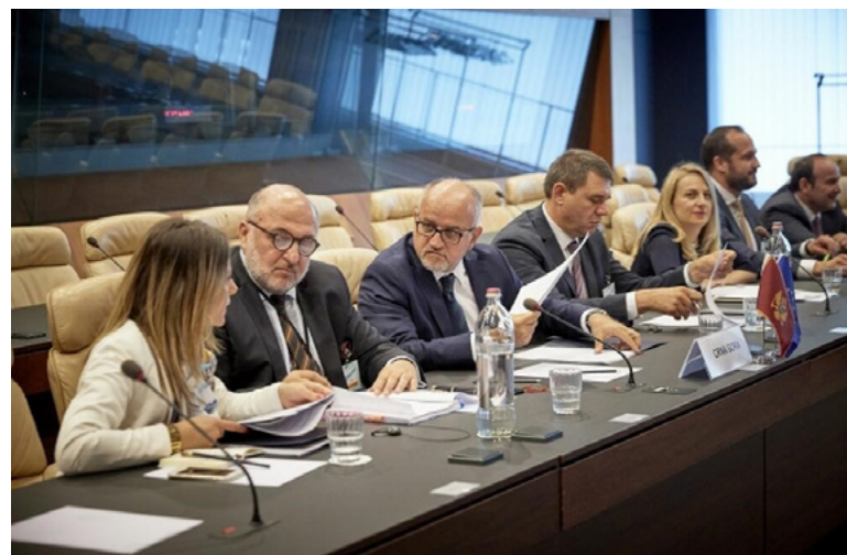
Foto: Otvaranje pregovaračkog poglavlja 17 – Ekonomska i monetarna unija, 25. jun 2018, Luksemburg

Ona je kazala da je nakon otvaranja i definisanja mjerila za privremeno zatvaranje poglavlja 17, u cilju dobijanja