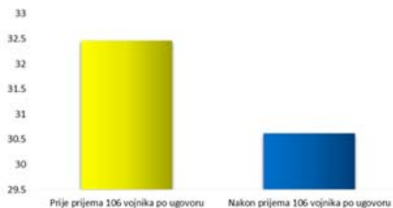
Slika 1. Prosječna starost vojnika po ugovoru

Stanje u oblasti ljudskih resursa karakteriše: neizbalansirana struktura ljudstva, nepovoljna starosna i kvalifikaciona struktura, kao i nesrazmjern odnos upravljačkog i komandnog kadra, u odnosu na izvršni.