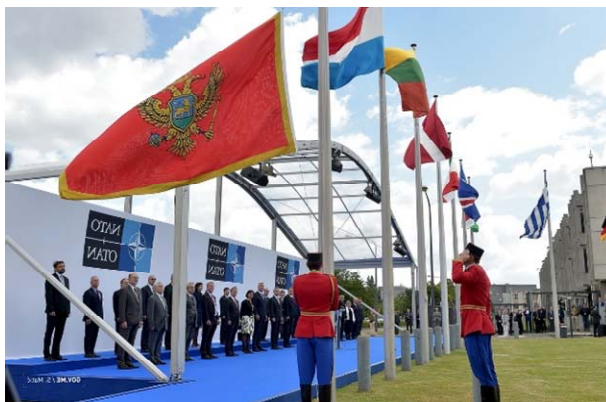
Podizanje zastave Crne Gore ispred NATO sjedišta

Konsolidacija bezbjednosnog stanja u regionu i mala vjerovatnoća direktne vojne prijetnje Crnoj Gori, sticanje punopravnog članstva Crne Gore u NATO, te benefiti i obaveze koji su iz njega proistekli, kao i sve zahtjevnije angažovanje Vojske na pružanju pomoći civilnim institucijama u zemlji, su nametnuli potrebu za preispitivanjem, inoviranjem i usklađivanjem cjelokupnog odbrambenog strateško-doktrinarnog okvira.