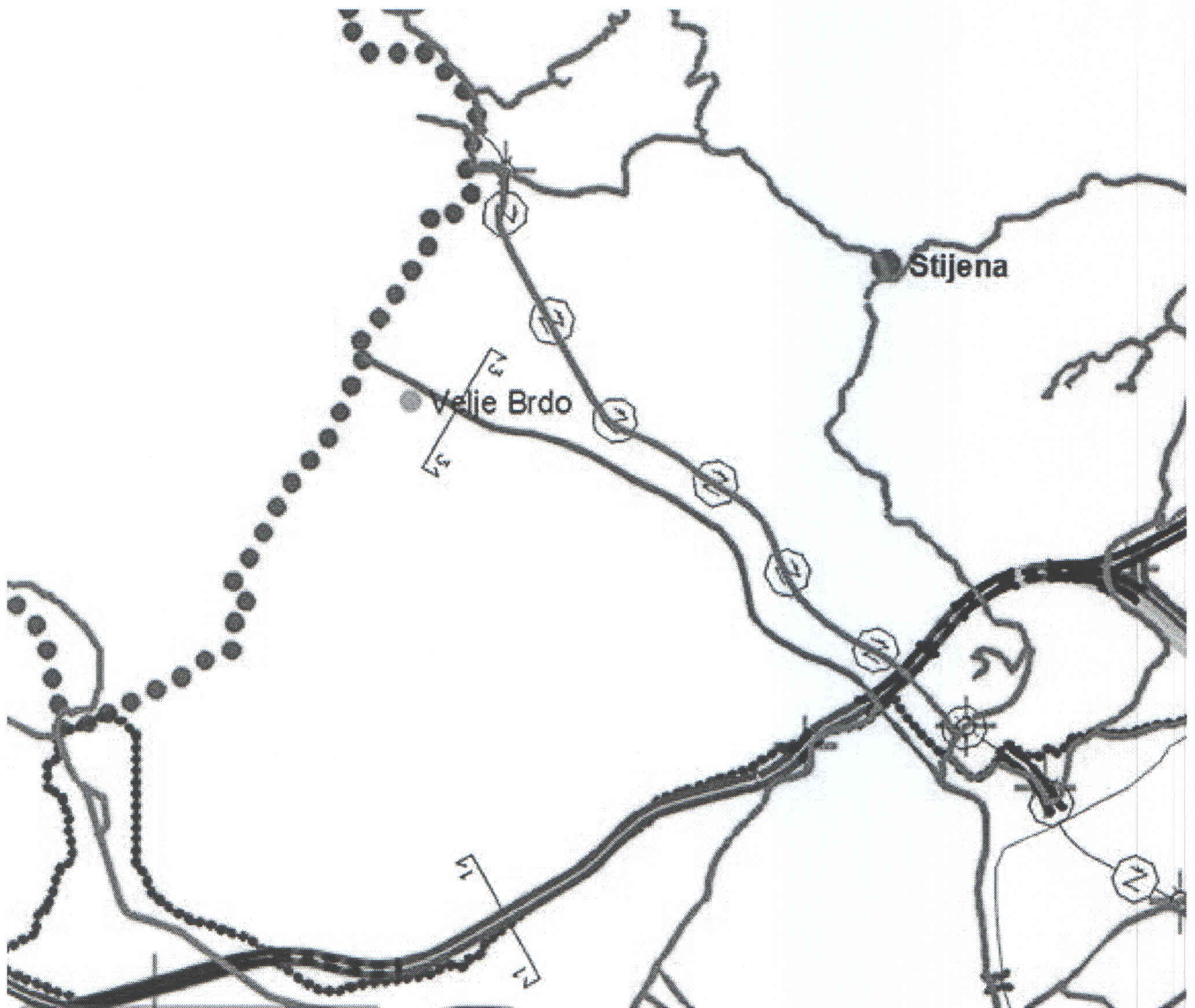
skica iz PUPa Podgorica A1 06 mreža saobraćajne infrastrukture