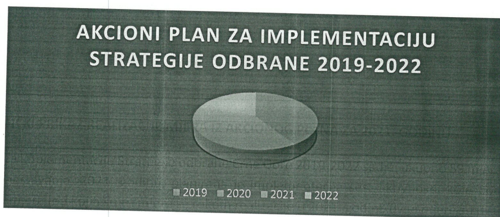
Grafikon 1: Prikaz ukupnog broja mjera

Akcioni plan za implementaciju Strategije odbrane Crne Gore 2019-2022 sadrži ukupno 59 mjera (indikatora). Za period izvještavanja, 2021. godinu, planirana je implementacija šest aktivnosti, koje podrazumijevaju realizaciju 10 mjera (od kojih su tri mjere sa rokom realizacije u 2021. godini, dvije mjere su u statusu stalnog zadatka, dvije mjere zahtijevaju kontinuirano praćenje, a za tri mjere rokovi su definisani u NATO paketu Ciljeva sposobnosti), što predstavlja 17% od ukupnog broja mjera iz Akcionog plana za implementaciju Strategije odbrane Crne Gore 2019-2022.