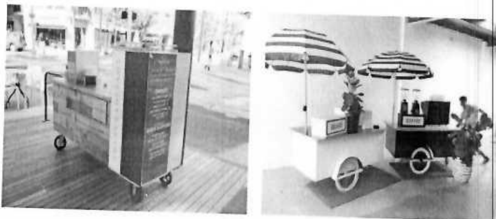
Primjeri prihvatljivih posebnih vozila za pružanje ugostiteljskih usluga u morskome dobru