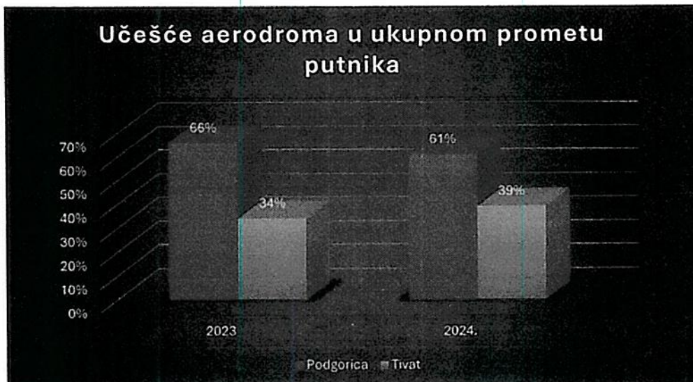
Dijagram 3 - Učešće aerodroma u ukupnom prometu putnika