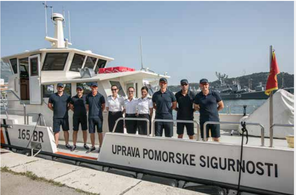
Institucija: Uprava za pomorske sigurnosti i upravljanje lukama