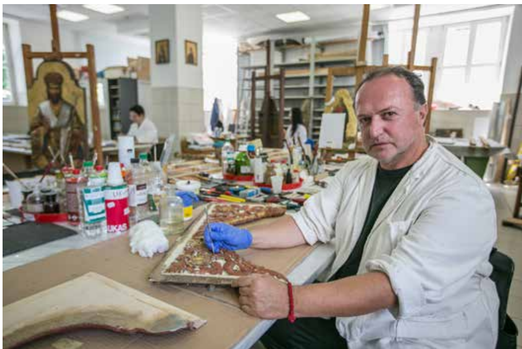
Institucija: Centar za konzervaciju i arheologiju Crne Gore