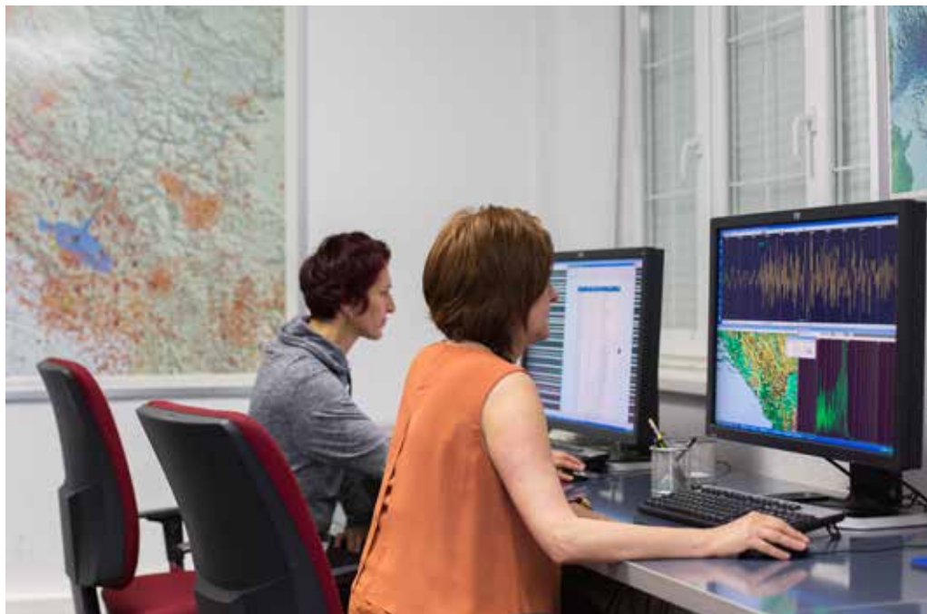
Institucija: Zavod za hidrometeorologiju i seizmologiju