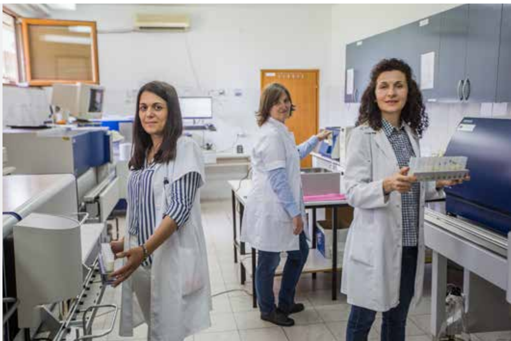
Institucija: Laboratorija za mljekarstvo