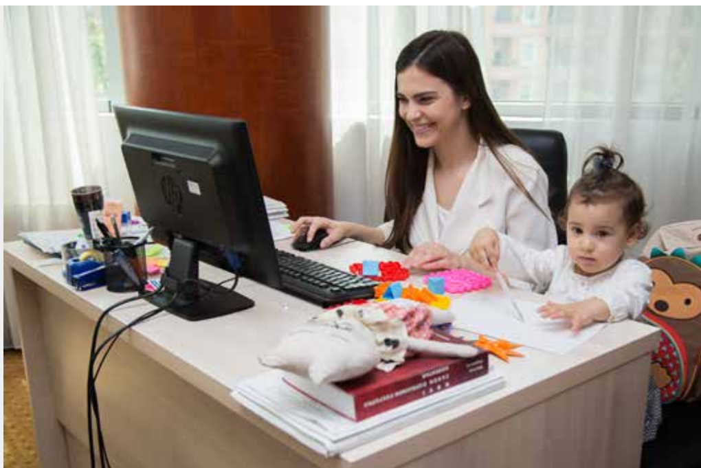
Institucija: Ministarstvo javne uprave