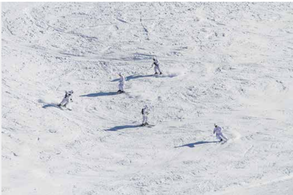
Institucija: Ministarstvo odbrane