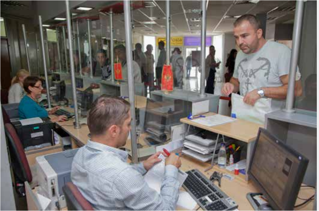
Institucija: Ministarstvo unutrašnjih poslova