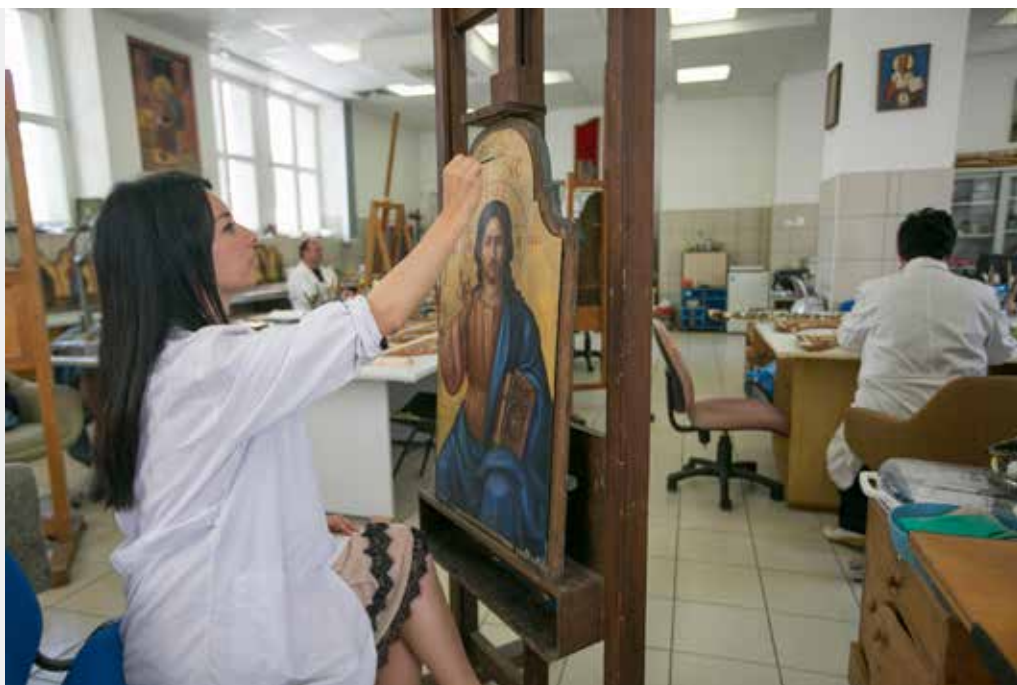
Institucija: Centar za konzervaciju i arheologiju Crne Gore