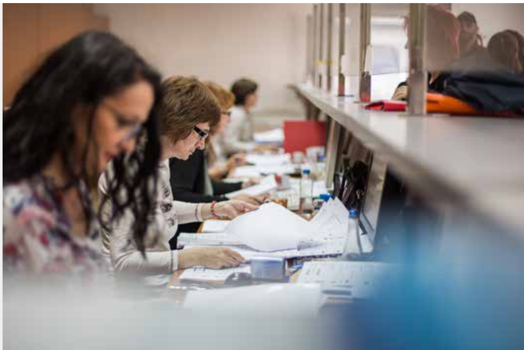
Institucija: Poreska uprava