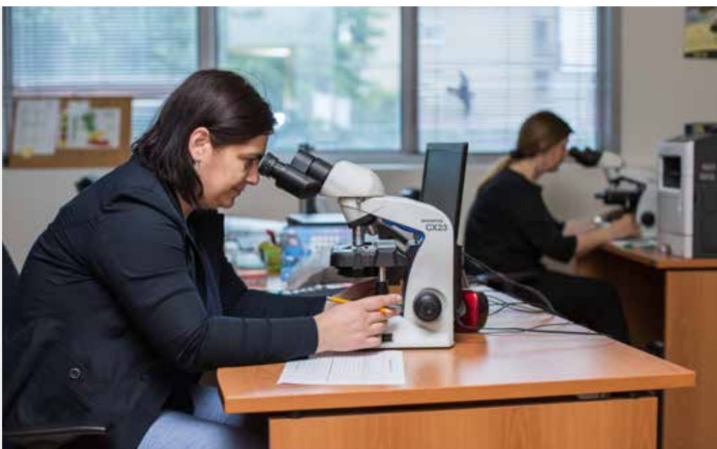
Institucija: Agencija za zaštitu prirode i životne sredine