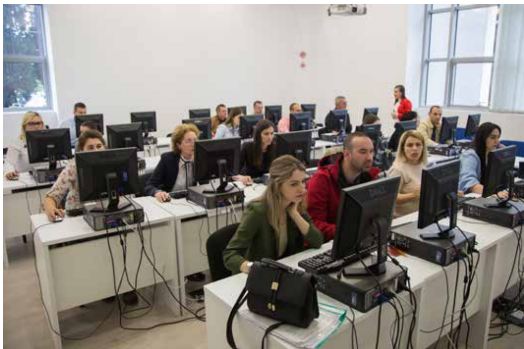
Institucija: Uprava za kadrove