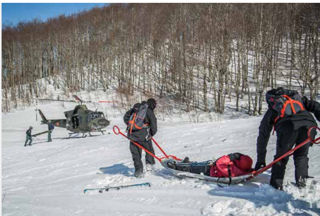
Institucija: Ministarstvo odbrane