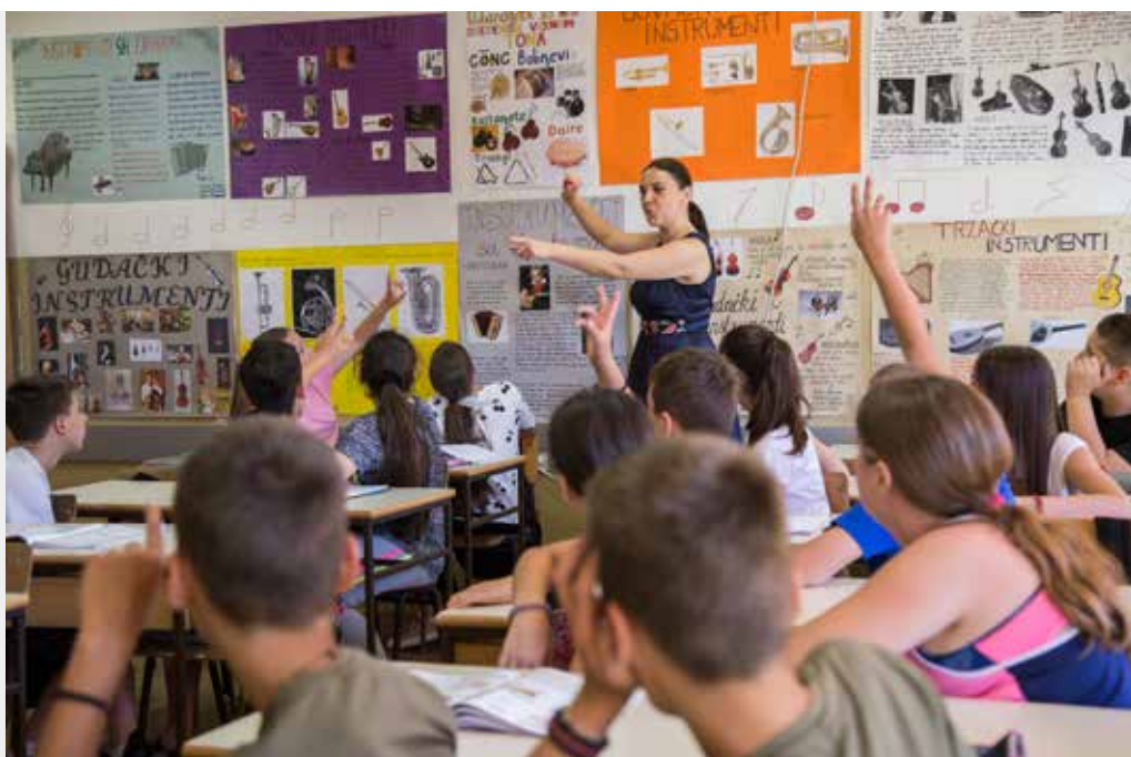
Institucija: Osnovna škola „Oktoih“