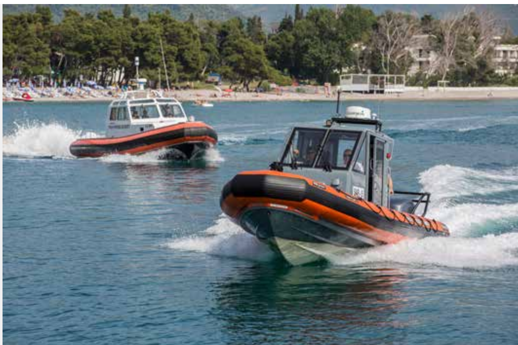
Institucija: Uprava za pomorske sigurnosti i upravljanje lukama