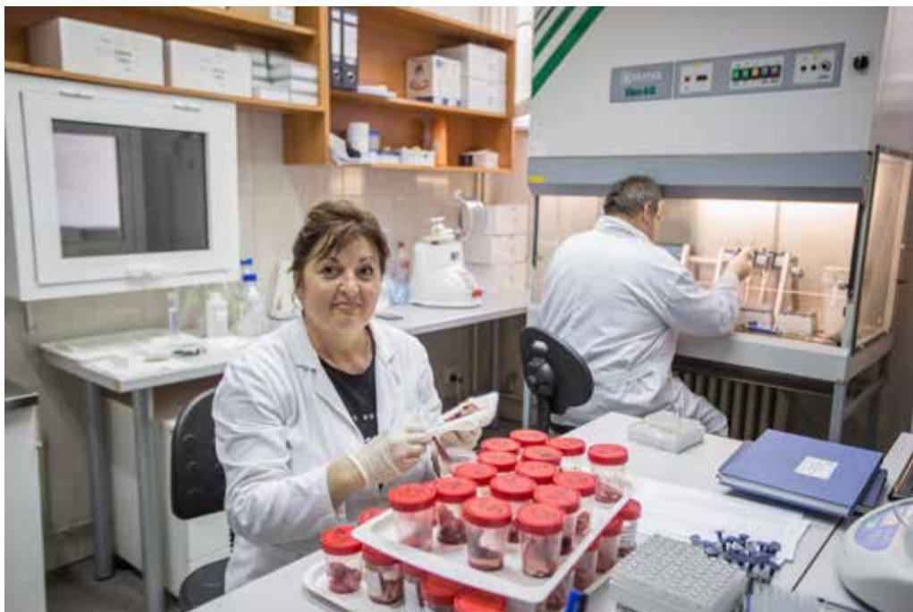
Institucija: Specijalistička veterinarska laboratorija