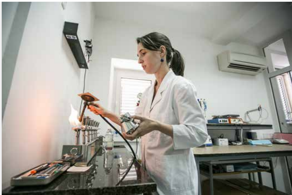
Institucija: Institut za biologiju mora