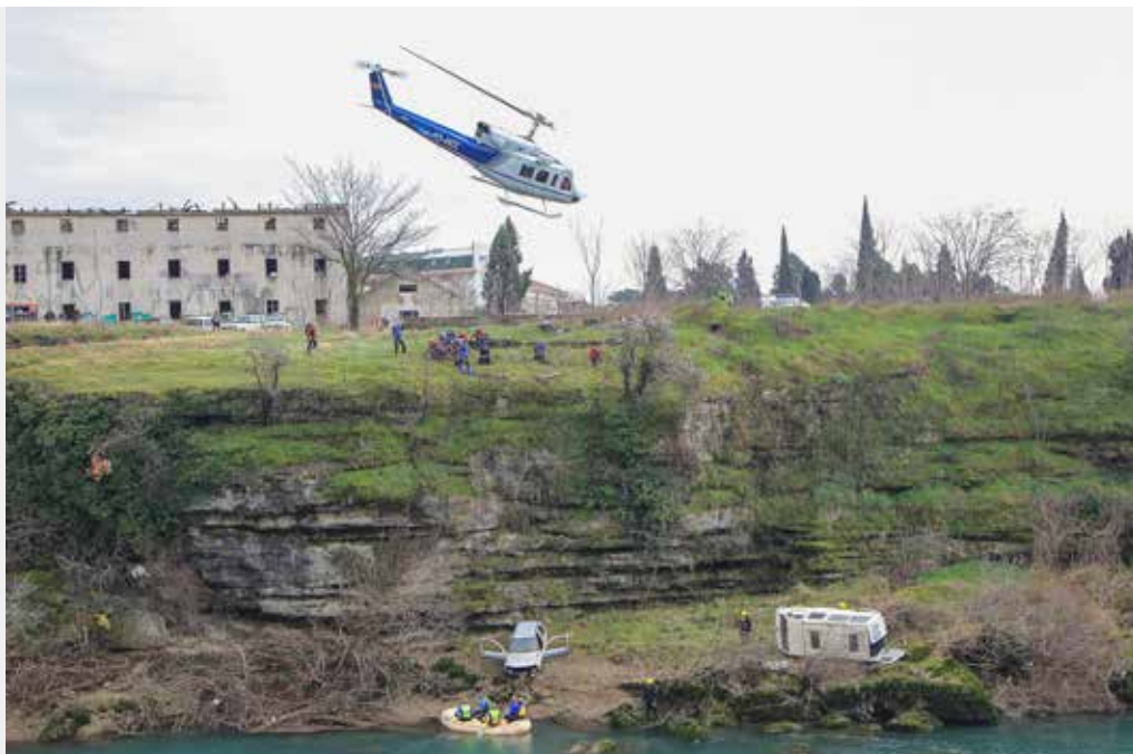
Institucija: Ministarstvo unutrašnjih poslova