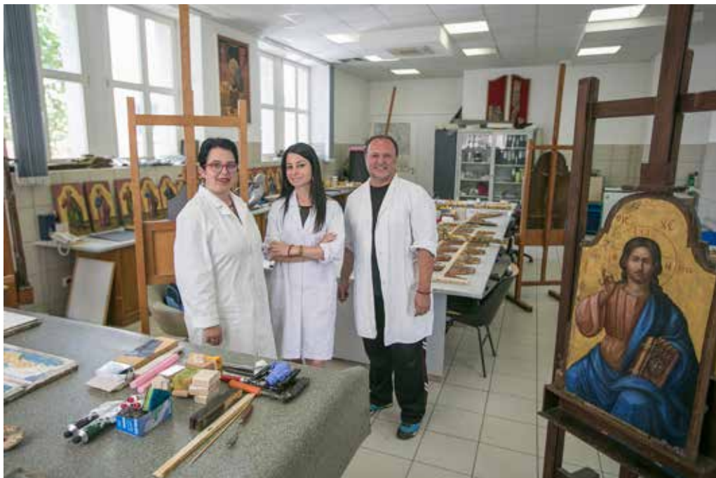
Institucija: Centar za konzervaciju i arheologiju Crne Gore