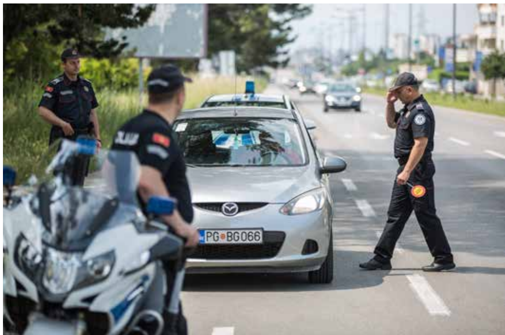
Institucija: Uprava policije