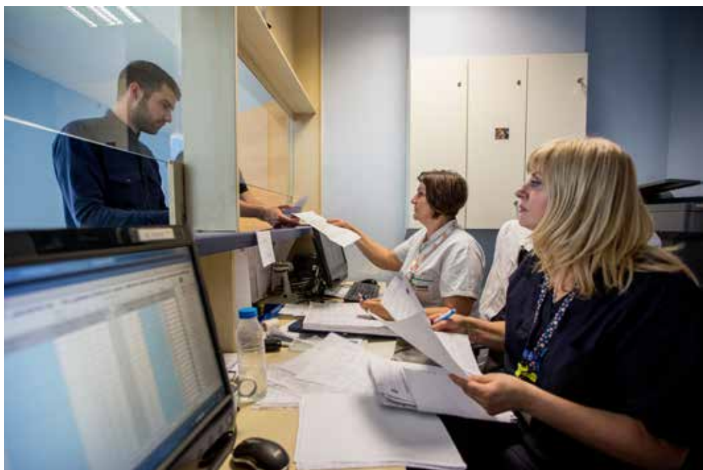
Institucija: Klinički centar Crne Gore