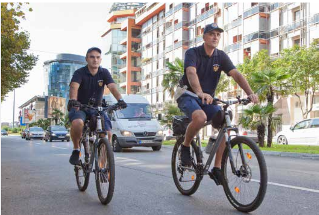
Institucija: Uprava policije