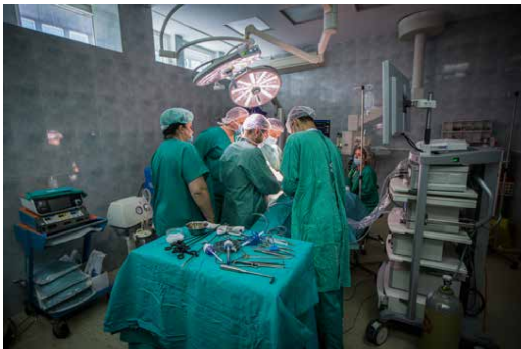
Institucija: Klinički centar Crne Gore