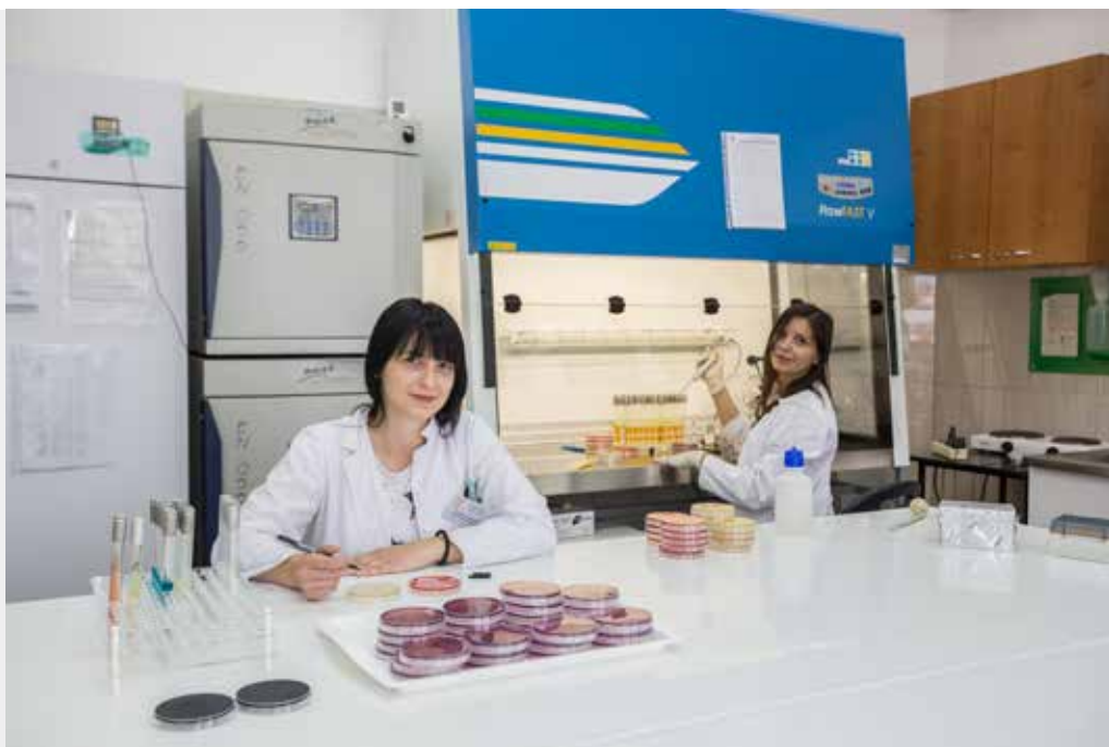
Institucija: Specijalistička veterinarska laboratorija