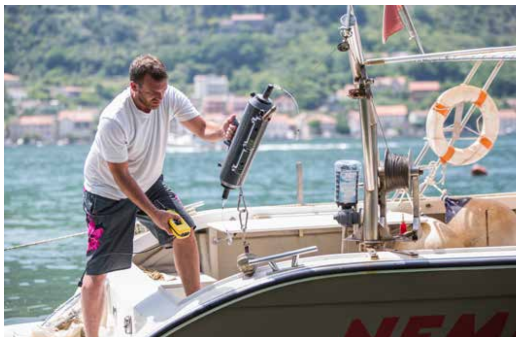
Institucija: Institut za biologiju mora