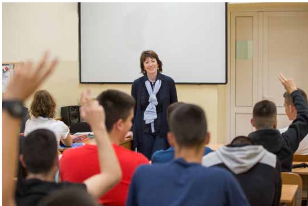
Institucija: Gimnazija „Slobodan Škerović“