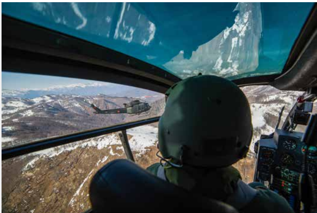
Institucija: Ministarstvo odbrane