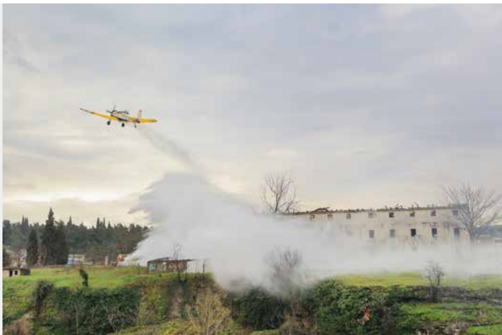
Institucija: Ministarstvo unutrašnjih poslova