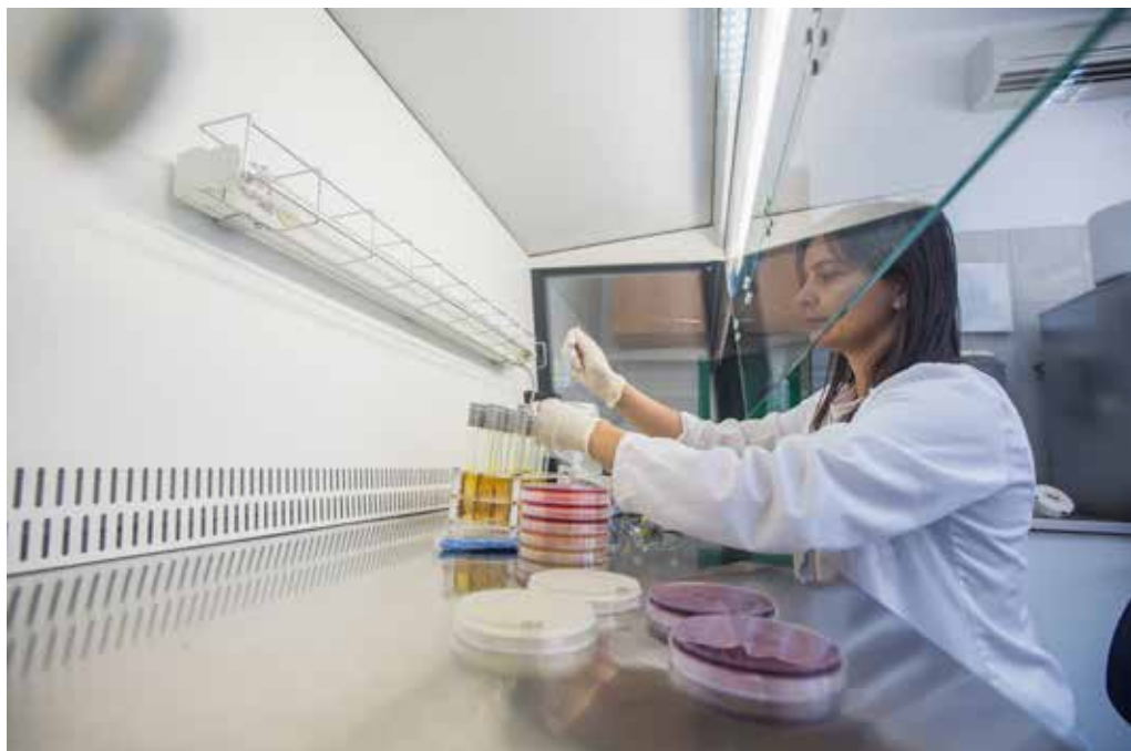
Institucija: Specijalistička veterinarska laboratorija