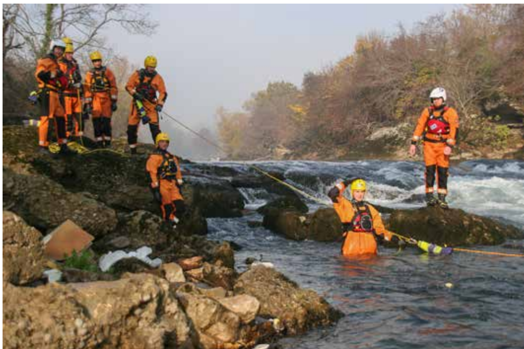
Institucija: Ministarstvo unutrašnjih poslova