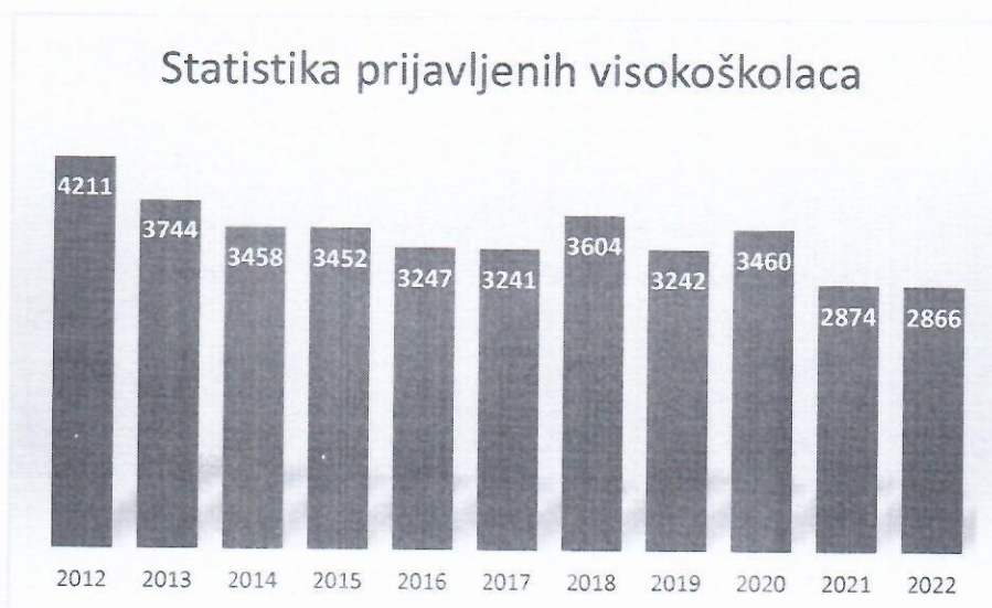
Slika 3. Statistika prijavljenih visokoškolaca po godinama