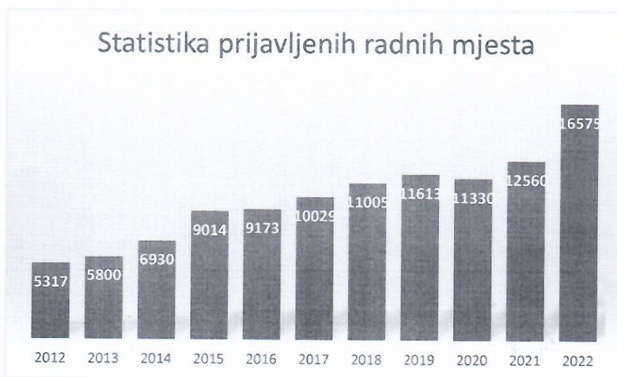
Slika 2. Statistika prijavljenih radnih mjesta kroz godine

Slika 2. prikazuje broj prijavljenih radnih mjesta od početka realizacije Programa stručnog osposobljavanja.