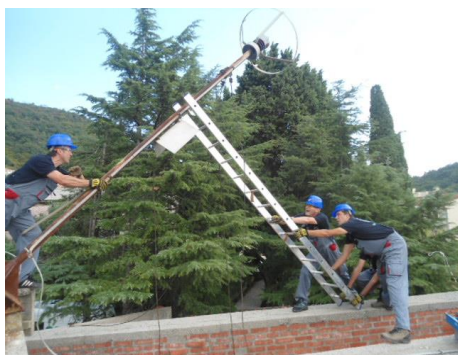
Slika 1: Uklanjanje radioaktivnog gromobrana sa hotela Castellastva u Petrovcu