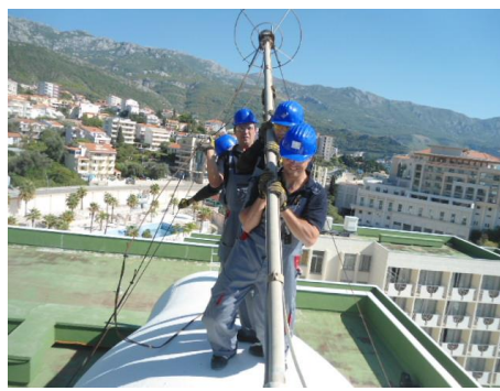
Slika 2: Uklanjanje radioaktivnog gromobrana sa hotela Mediteran u Bečićima

Sigurno i bezbjedno upravljanje radioaktivnim izvorima zračenja je osnovna aktivnost kojom se postiže očuvanje i zaštita života i zdravlja sadašnjih i budućih generacija i zaštita životne i radne sredine. Važno je istaći da je Crna Gora sopstvenim kapacitetima implementirala najzahtjevniju fazu projekta-skidanje, prevoz (transport) i skladištenje radioaktivnih gromobrana i iskorišćenih zatvorenih radioaktivnih izvora.