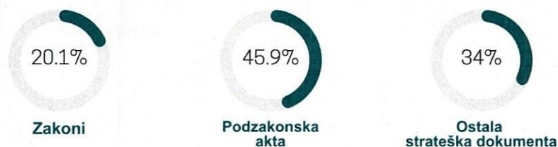
Grafik 1 – Ukupan broj propisa u 2023. godini

Tokom 2023. godine Ministarstvo finansija je dalo ukupno 368 mišljenja na predloge akata i prateće izvještaje o analizi uticaja propisa. Od posmatranih 368 akata, 74 (20.11%) su se odnosila na zakone, 169 (45.92%) na podzakonska akta i 125 (33.97%) na ostala strateška dokumenta (strategije, akcione planove, programe, sporazume, informacije).