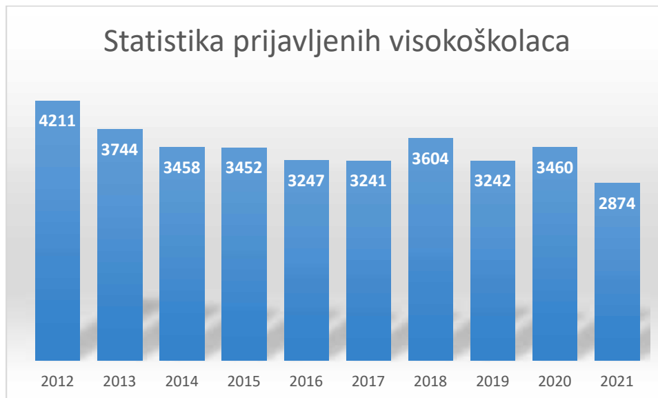
Slika 3. Statistika prijavljenih visokoškolaca po godinama

Slika 3. Prikazuje statistiku prijavljenih visokoškolaca kroz godine.