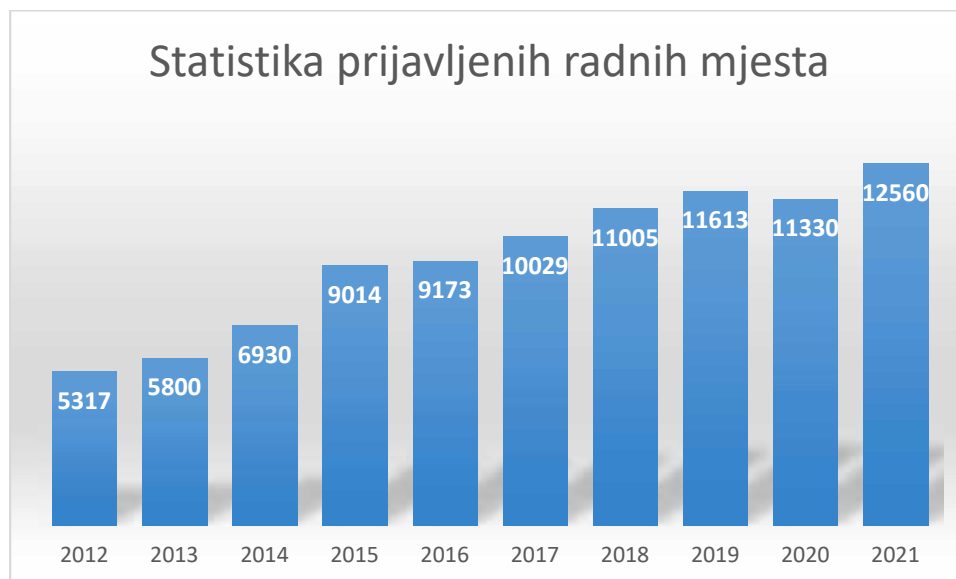
Slika 2. Statistika prijavljenih radnih mjesta kroz godine

Slika 2. prikazuje broj prijavljenih radnih mjesta od početka realizacije Programa stručnog osposobljavanja.