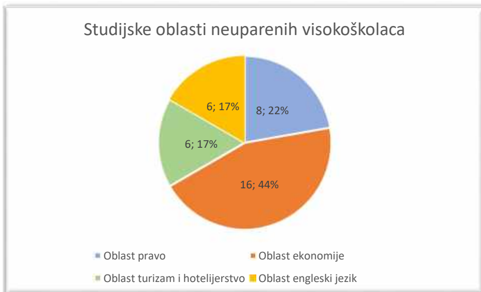
Slika 4. Studijske oblasti sa najviše neuparenih visokoškolaca

Slika 4. prikazuje studijske oblasti sa najvećim brojem neuparenih visokoškolaca.