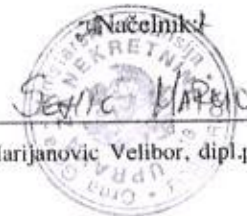
Marijanovic Velibor, dipl.pravnik

Taksa je oslobođena na osnovu člana 13 i 14 Zakona o administrativnim taksama ("Sl.list RCG" br. 55/03, 46/04, 81/05 i 02/06, "Sl.list CG" 22/08, 77/08, 03/09, 40/10, 20/11 i 26/11).