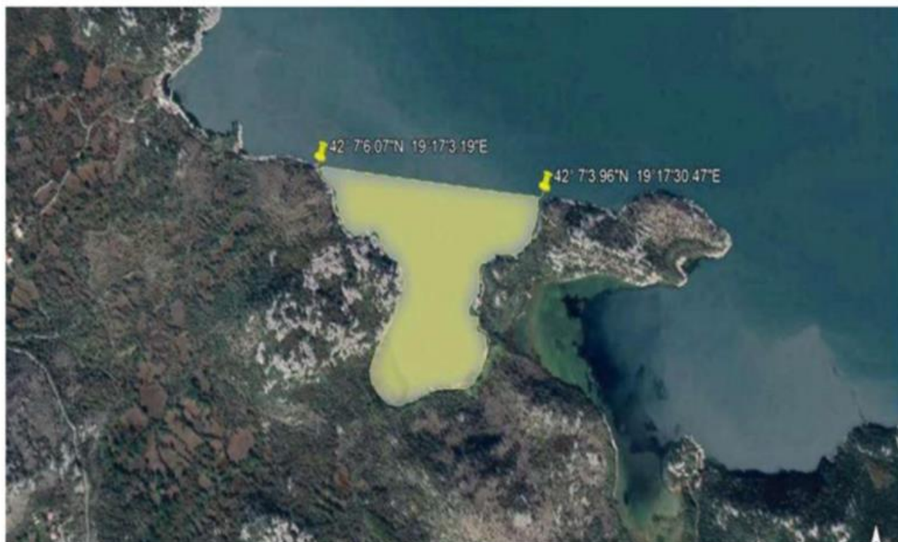
Bjace - ribolovni zabran utvrđen je za označeni dio na orto-foto snimku