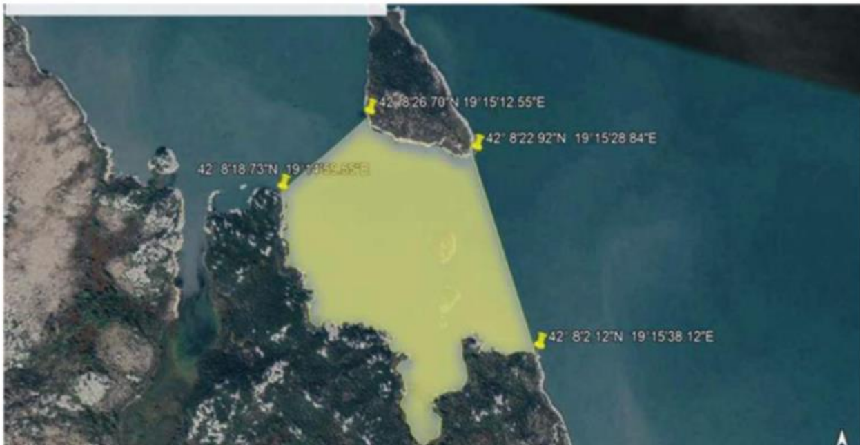
Sijerča - ribolovni zabran utvrđen je za označeni dio na orto-foto snimku