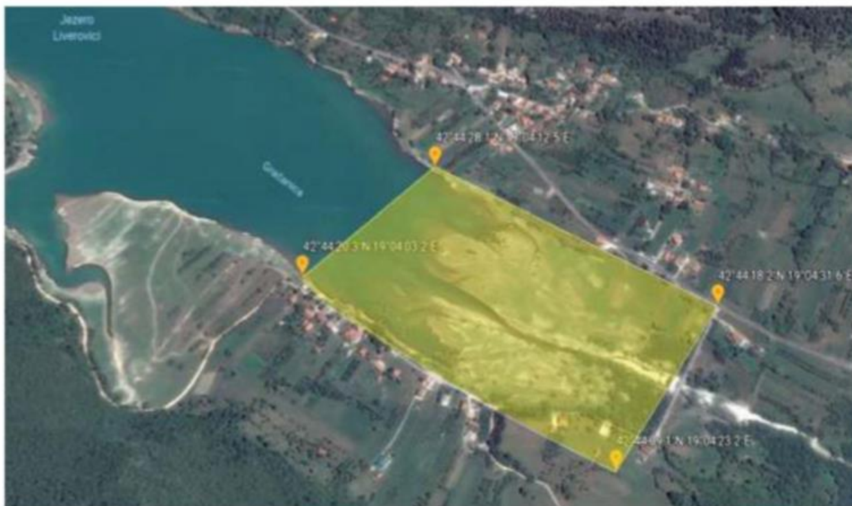
Raduš - ribolovni zabran utvrđen je za označeni dio na orto-foto snimku