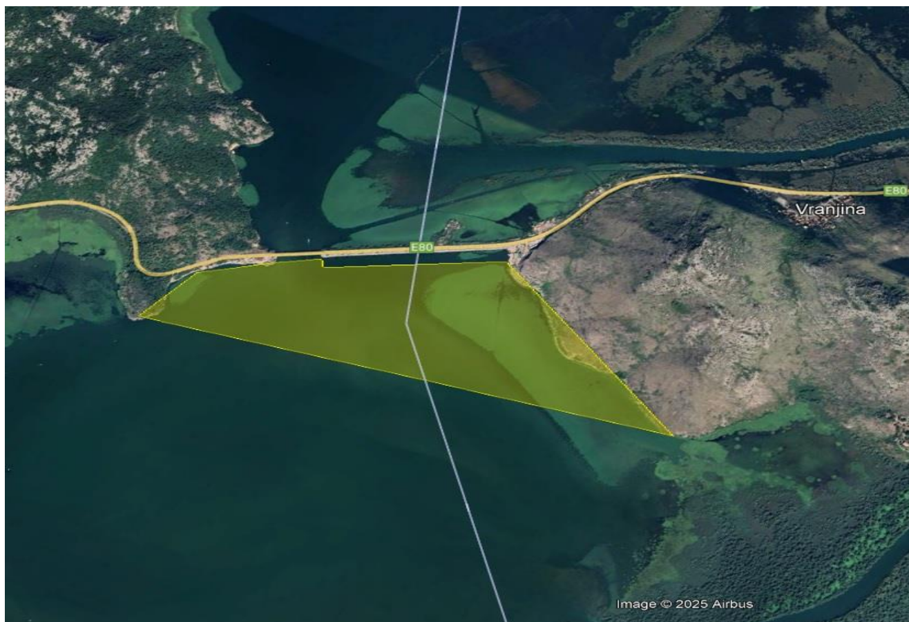
Vranjina – Most tanki Rt II - ribolovni zabran utvrđen je za označeni dio na orto-foto snimku