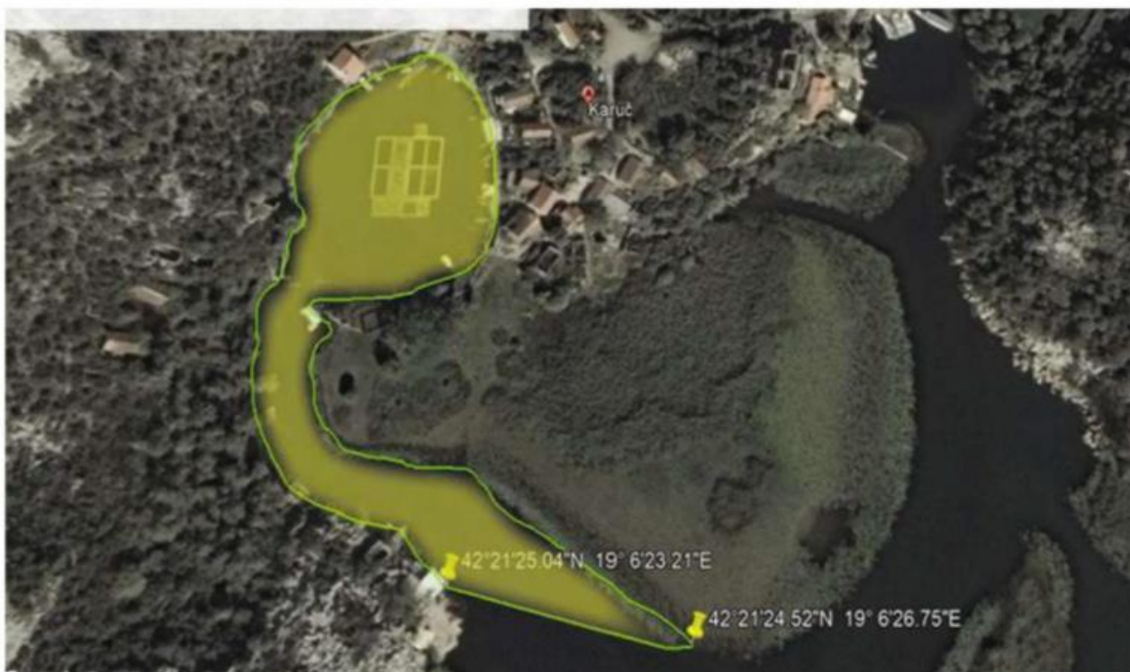
Vaškaut - ribolovni zabran utvrđen je za označeni dio na orto-foto snimku