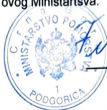
Filip Radulović MINISTAR

UPUSTVO O PRAVNOJ ZAŠTITI: Protiv ovog rješenja može se izjaviti žalba Agenciji za zaštitu ličnih podataka i slobodan pristup informacijama, u roku od 15 dana od dana dostavljanja rješenja, neposredno ili preko ovog Ministarstva.