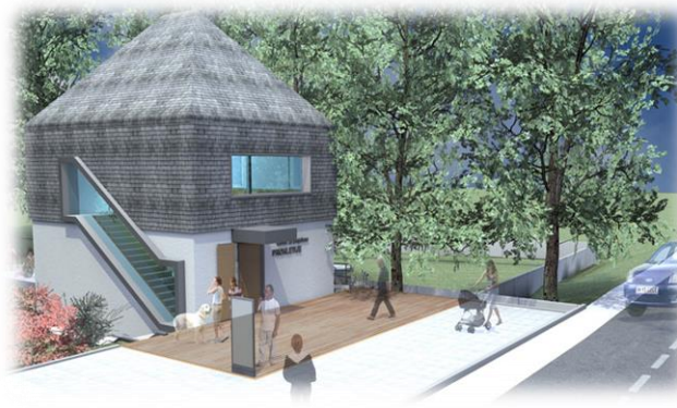
Centar za posjetioce u Gusinju-NP Prokletije