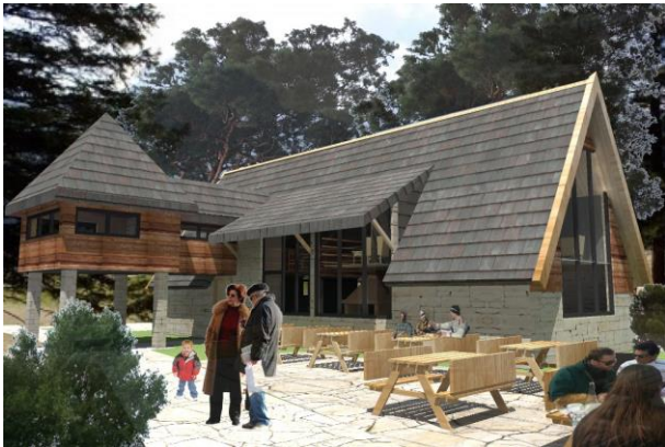
Restoran na Crnom jezeru-NP Durmitor