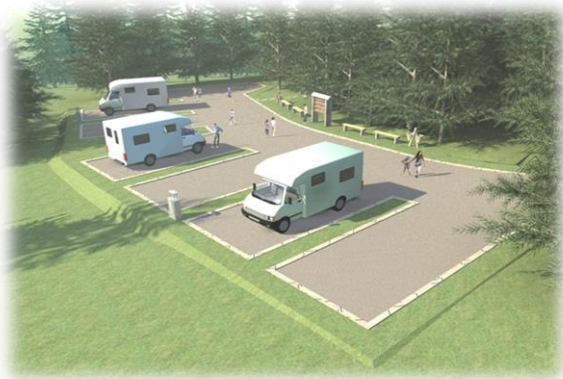
Mobil-home- NP Durmitor