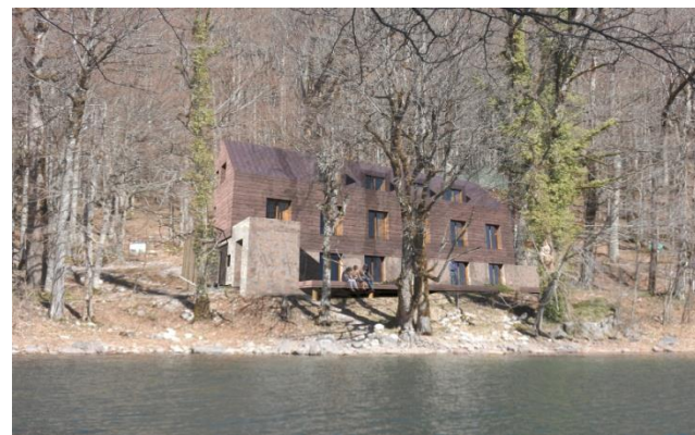
Hotel na Biogradskom jezeru-NP Biogradska gora

CRNE GORE NACIONALNI PARKOVI CRNE GORE NACIONALNI PARKOVI CRNE GORE NACIONALNI PARKOVI CRNE GORE NACIONALNI PARKOVI CRNE GORE NACIONALNI PARKOVI CRNE GORE NACIONALNI PARKOVI CRNE GORE NACIONALNI PARKOVI