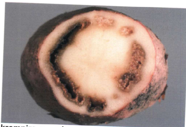
Slika 4 : Simptomi smeđe truleži krtola krompira u zavisnosti od nivoa zaraze bakterijom Ralstonia solanacearum

Obradivač: Gordana Fuštić, sam. savjetnik I efuško Odsjek za zdravstvenu zaštitu bilja