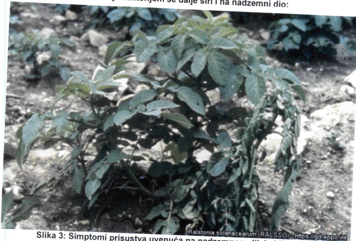
Slika 3: Simptomi prisustva uvenuća na nadzemnom dijelu biljke krompira

Iz zaraženih krtola infekcija bakterijom se dalje širi i na nadzemni dio: