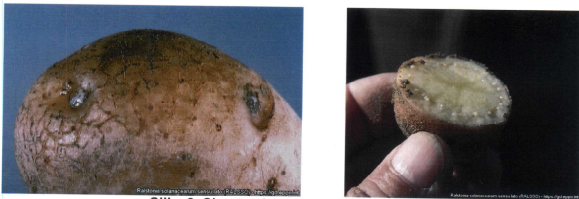
Slika 2: Simptomi smeđe truleži krtola krompira