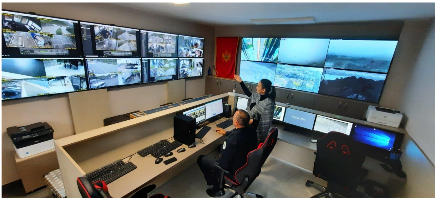
Nacionalni koordinacioni centar NCC Podgorica