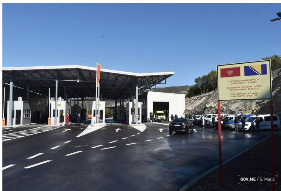
Zajednički granični prelaz Vraćenovići – Deleuša, počeo je da funkcioniše 20. oktobra 2020. godine.

U cilju unapređenja granične infrastrukture postignut je određeni napredak. Sredstvima SBP, izgrađen je Zajednički granični prelaz Vraćenovići–Deleuša između Crne Gore i BiH, na putnom pravcu Nikšić–Bileća, koji je počeo da funkcioniše 20. oktobra 2020. godine. Započeta je izgradnja graničnog prelaza Ranče-Jabuka, između Crne Gore i Republike Srbije, na putnom pravcu Pljevlja-Prijepolje. Urađeno je Idejno rešenje za izgradnju Zajedničkog graničnog prelaza Čemerno-Granice, između Crne Gore i Republike Srbije, na putnom pravcu Pljevlja- Priboj. Urađeno idejno rešenje za rekonstrukciju GP Kobila. U završnoj fazi je rekonstrukcija puta Dinoša-Zatrijebačka Cijevna, koji je preduslov za otvaranje izgrađenog Zajedničkog graničnog prelaza Zatrijebačka Cijevna- Grabon, između Crne Gore i Republike Albanije, na putnom pravcu Podgorica-Dinoša, preko teritorije Albanije do Gusinja. Urađeno Idejno rješenje za buduću zgradu Sektora granične policije sa NCC-om. Za objekte granične policije u Pljevljima, Rožajama, Budvi (za sjedište Regije Jug) određene su lokacije, urađena je adaptacija objekata za Graničnu policiju u Risnu i Ulcinju.