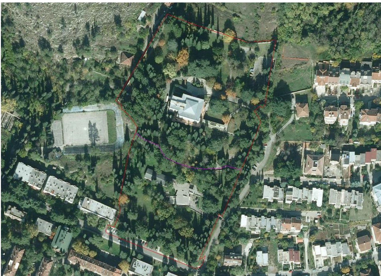
Slika 4 - Ortofoto prikaz sa granicom obuhvata