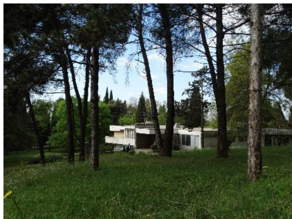
Slika 2 - Postojeći CANU objekat

nesprovedenja odgovarajućih mjera njege čitava površina zahtijeva stabilizovanje ukupnog kvaliteta zelenila.