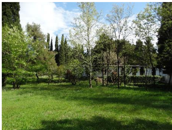
Slika 3 - Predmetna lokacija

Lokacija obuhvata katastarsku parcelu broj 2389 kao i djelove katastarskih parcela br. 2390, 2391, 2350/1, 2393, 2594/1, 2395/2, KO Podgorica II, Glavni grad Podgorica. Ukupna površina zahvata konkursa iznosi 33.273,76 m 2 .