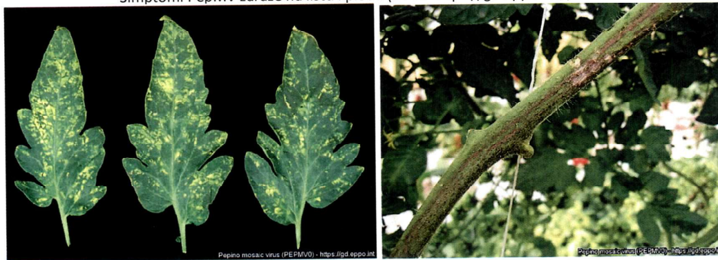
Simptomi PepMV zaraze na listu i stablu