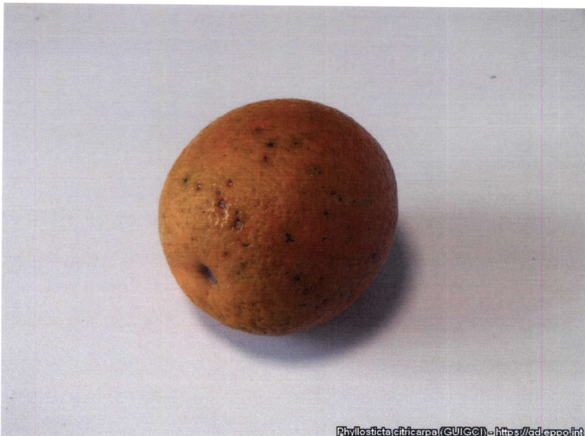
Phyllosticta citricarpa (GUIGCI) - https://gd.eppo.int