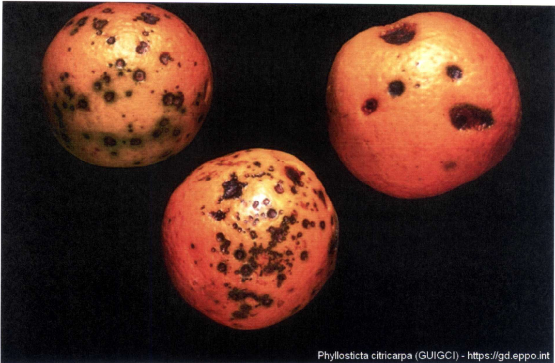
Phyllosticta citricarpa (GUIGCI) - https://gd.eppo.int