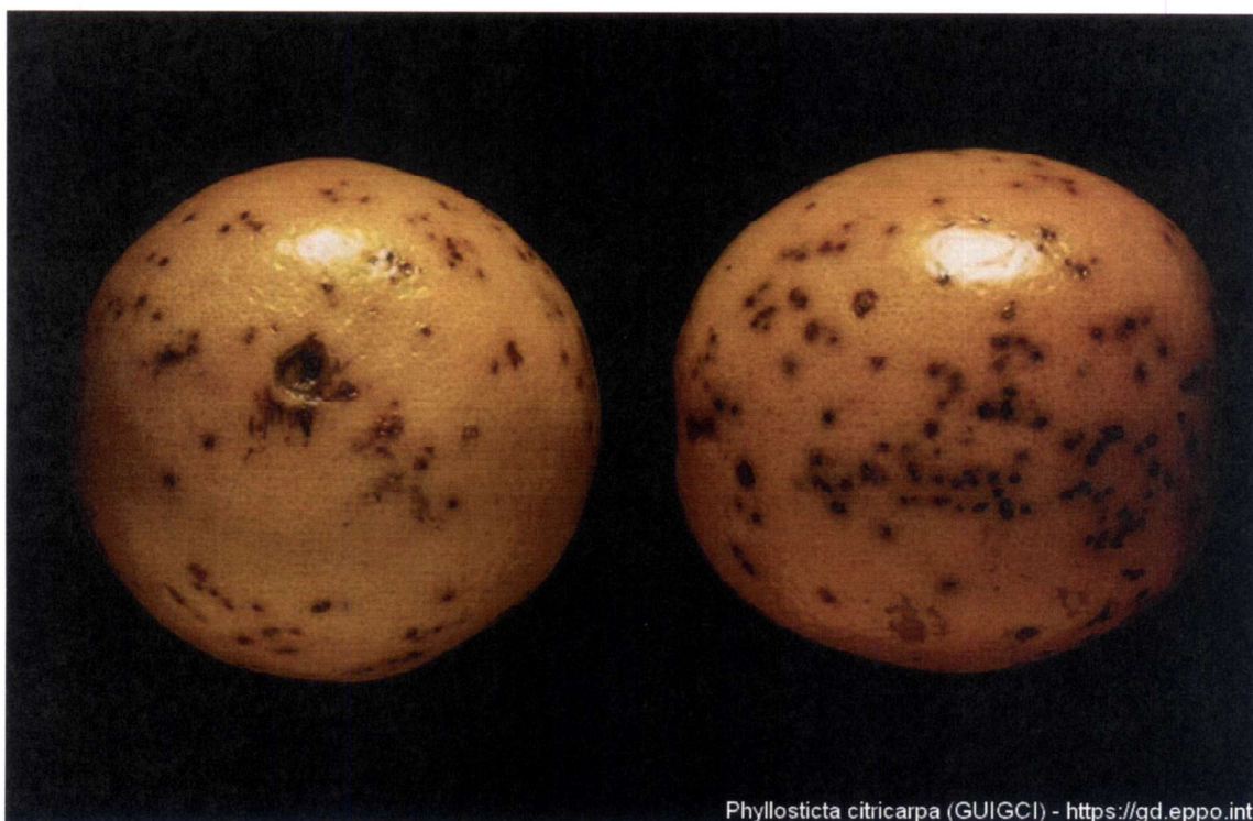
Phyllosticta citricarpa (GUIGCI) - https://gd.eppo.int