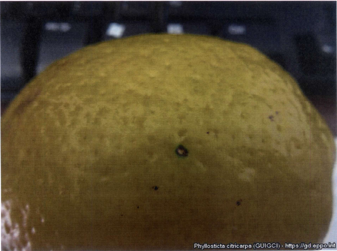
Phyllosticta citricarpa (GUIGCI) - https://gd.eppo.int