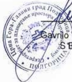
mr Radmila Maljević, dipl.ing. saobr. RUKOVODITELJKA SEKTORA

Shodno članu 62 Zakona o upravnom postupku ("Sl.list CG", br. 56/14, 20/15, 40/16 i 37/17), dostavljamo vam zahtjev Službe Glavnog gradskog arhitekta za izdavanje urbanističko-tehničkih uslova za objekat Kulturnog centra u funkciji promocije arheološkog i kulturnog nasljeđa Duklje, na kat. parceli broj 614/1 KO Velje Brdo i kat. parceli broj 1798/1 KO Podgorica I u Podgorici, kao nadležnom organu za postupanje po istom, jer se radi o objektu bruto površine min. 4.200,00m 2 – max. 6.000,00m 2 .