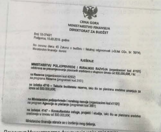
Документ Министарства финансија који свједочи о преусмјеравању пола милиона за консултантске услуге

Ресору пољопривреде крајем априла одобрено је да преусмјери 247.971 еуро са програма „пољопривреда и рибарство“, „остали