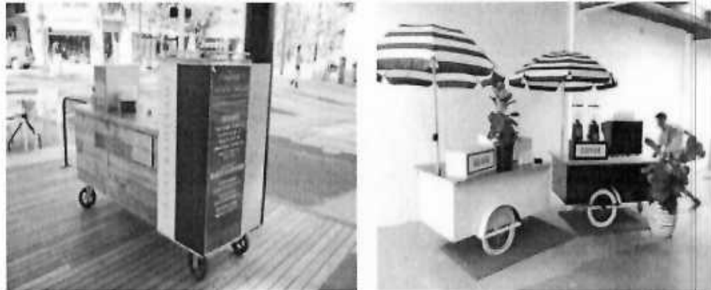
Primjeri prihvatljivih posebnih vozila za pružanje ugostiteljskih usluga u morskome dobru