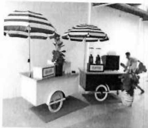
Primjeri prihvatljivih posebnih vozila za pružanje ugostiteljskih usluga u morskome dobru