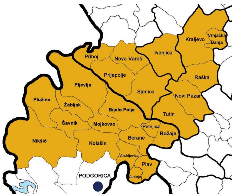
Mapa programskog područja

Programsko područje pretežno je planinsko sa dobro očuvanom prirodom. Najvažniji prirodni resursi obuhvataju šume, vode i mineralne resurse.