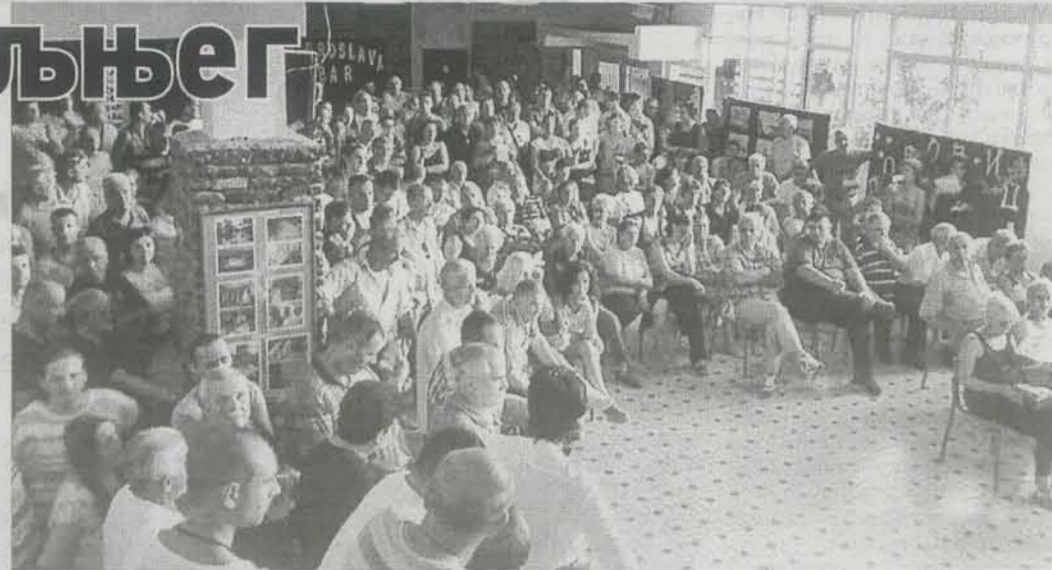
Спорни збор грађана