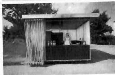
Slike: Primjeri prihvatljivog dizajna kioska za trgovinu i usluge u morskome dobru