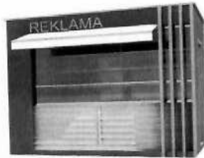
Slike: Primjeri prihvatljivog dizajna kioska za štampu u morskome dobru