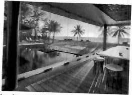
Slike: Primjeri prihvatljivog zastakliivanja u gostiteljske terase